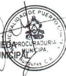
ABG. FREDY PINEBA PROCURADURIA MUNICIPAL