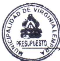
SANDRA JUDIT ARGUETA LAINEZ CONTABILIDAD Y PRESUPUESTO