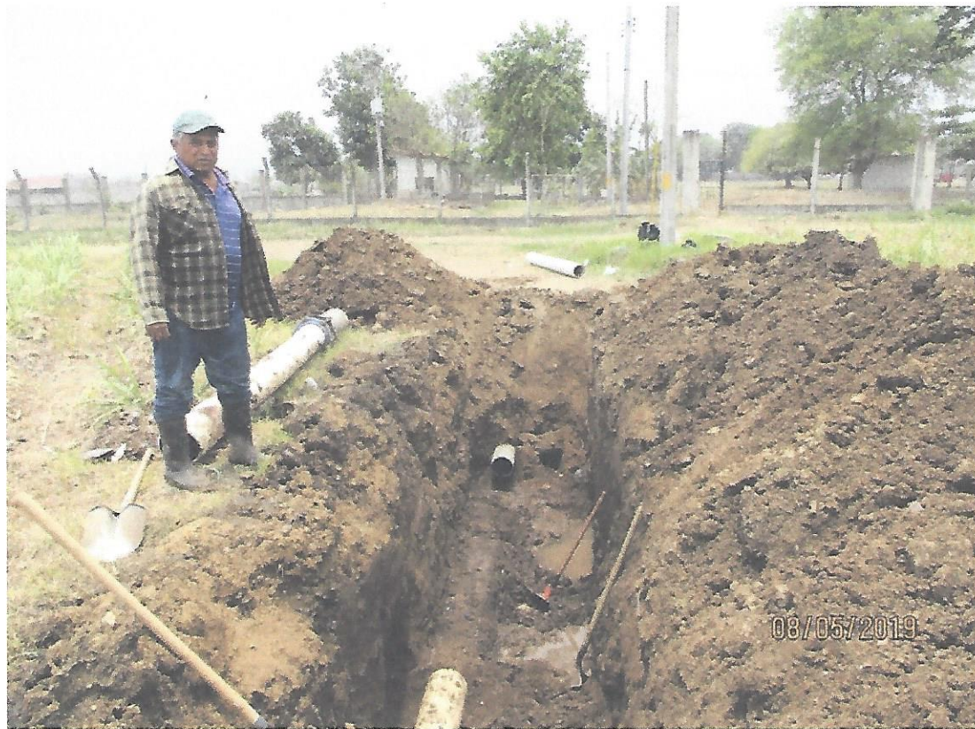
5. Reparación de tanque Vivero Municipal