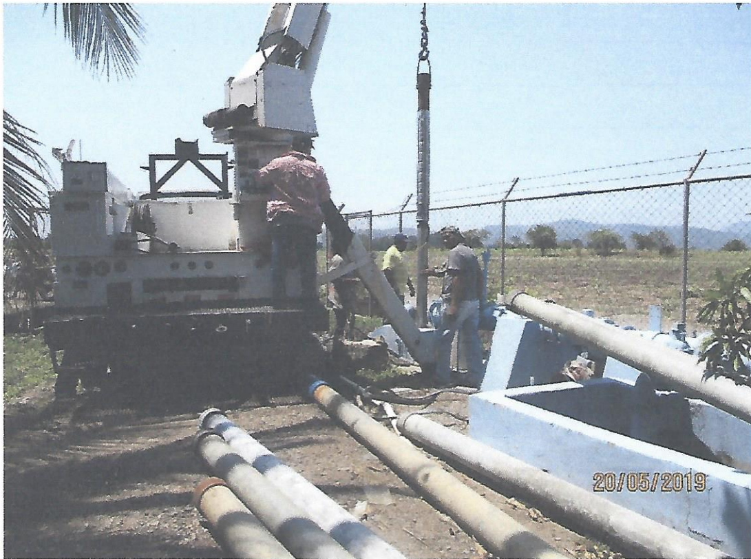
3. Cambio de válvula de 3" en El Calan.