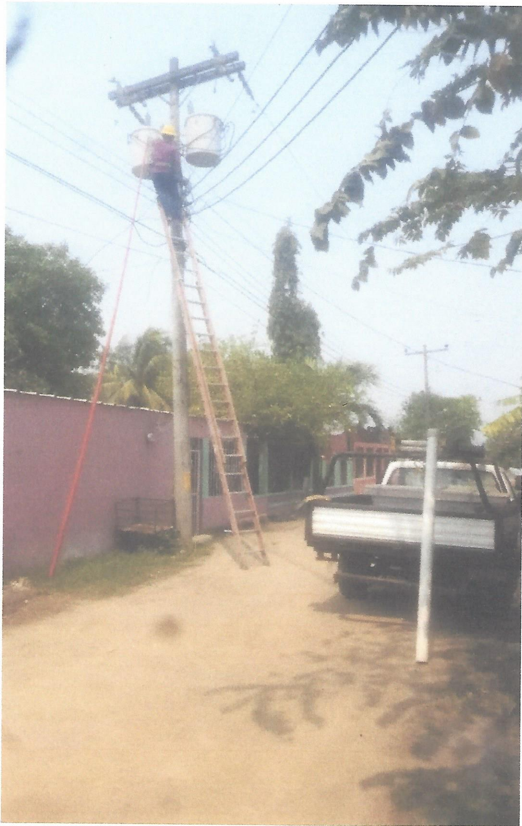
14. Cambio de crucetas en banco de transformadores en el Pozo #5 Zona Cañeras.