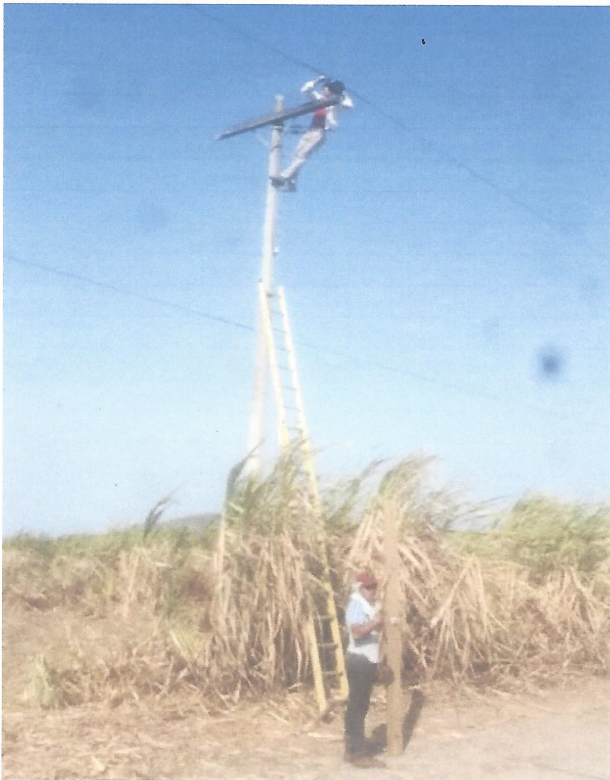
15. Alcantarillado Sanitario limpieza y sacando obstrucciones en cajas y holes en los diferentes Barrios y Colonias del Municipio.