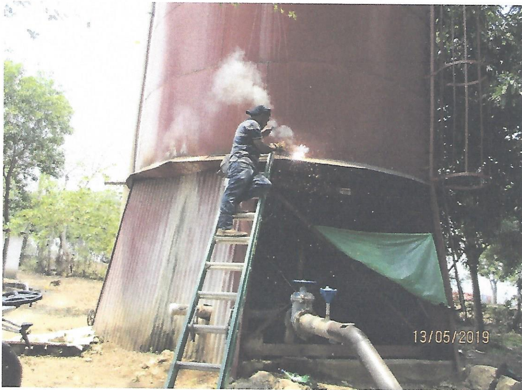
6. Desmontaje de bomba centrífuga de 50 HP en Tanque Martin Fajardo.