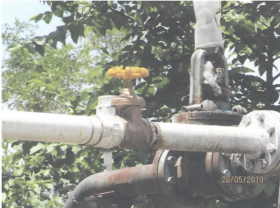
4. Reparación de 2 fugas en tubería de impulsión de 8" entre Pozos #2 y 4 Zona Cañera.