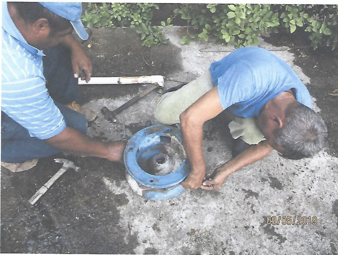
7. Reparación de tubería de impulsión de 6" en El Higo.