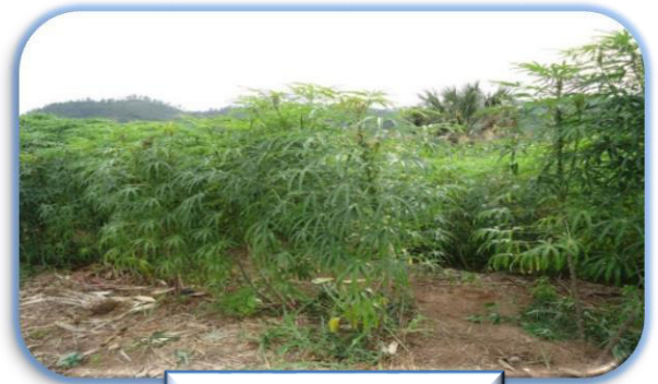
Cultivo de yuca