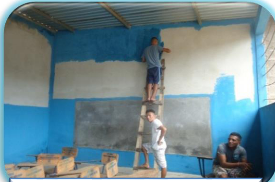
Aulas de educación formal C.P. de Olanchito