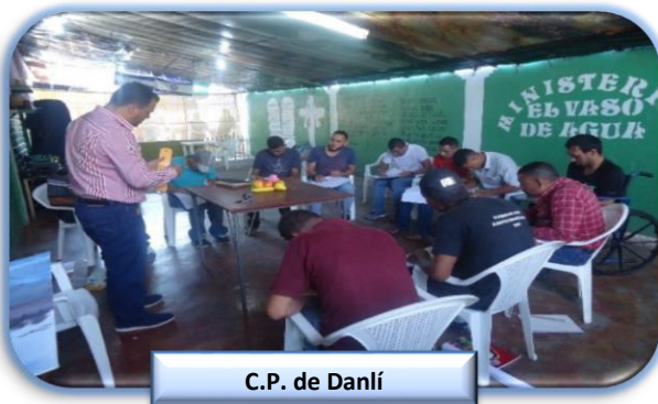
C.P. de Danlí