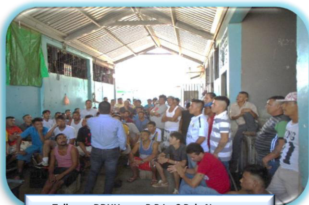
Taller en DDHH para P.P.L. C.P de Nacaome