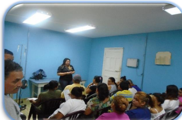
Taller de Violencia Intrafamiliar C.P. de Trujillo