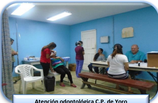
Atención odontológica C.P. de Yoro