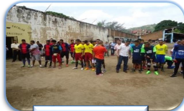
Futbolito en C.P. Danlí

7,187 Privados de libertad participaron en actividades recreativas y deportivas a nivel nación como parte de la terapia de dispersión.