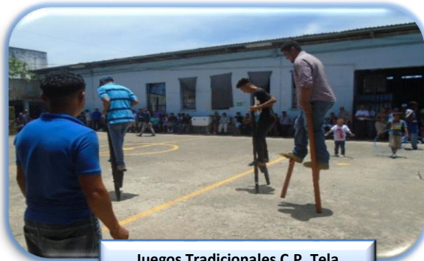
Juegos Tradicionales C.P. Tela