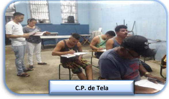
C.P. de Tela