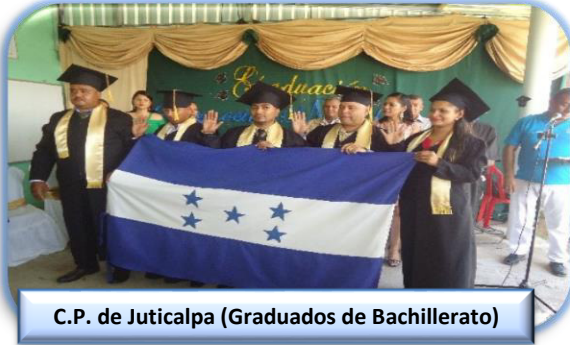
C.P. de Juticalpa (Graduados de Bachillerato)

Participan en educación 3,502 privados de libertad a nivel nacional en los programas de ALFASIC y EDUCATODOS en septiembre se realizaron graduaciones en el centro penal de Juticalpa en Bachillerato en Ciencias y Humanidades.