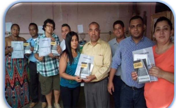
Discipulado en El Porvenir