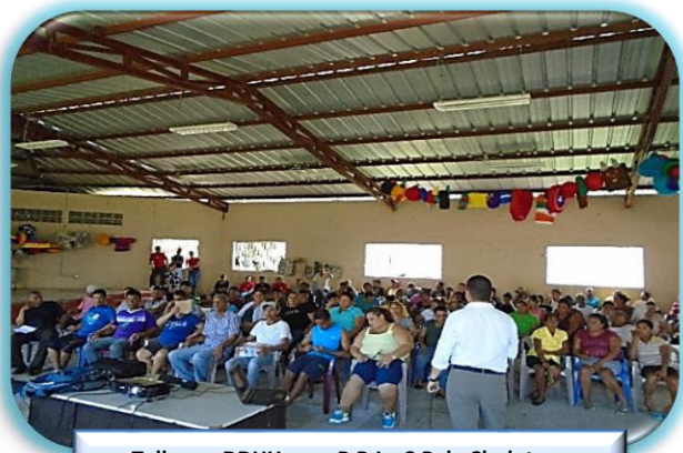
Taller en DDHH para P.P.L. C.P de Choluteca

Con el fin de sensibilizar a los funcionarios que laboran en los diferentes establecimientos penitenciarios acerca de su papel particular en la promoción y la protección de los derechos humanos, se realizaron talleres en los que participaron 140 empleados administrativos y operativos en talleres de Derechos Humanos en los Centros Penitenciarios de Nacaome, Choluteca, Morocelí.