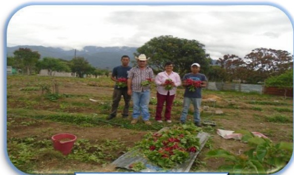
Cultivo de Rábanos

Se cultivaron en huertos agrícolas producción: sandía, malanga, piña, yuca, pepino, rábano, zapallo, camote y plátano.