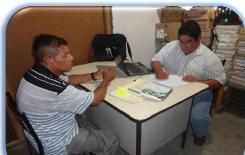
Estudio socioeconómico Nacaome Valle