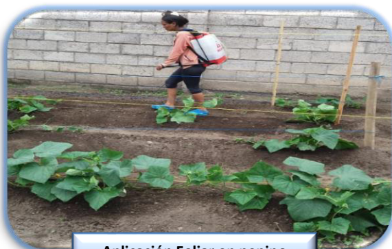
Aplicación Foliar en pepino

Las internas participaron en la siembra de huertos cultivando de frijol, pepino, tomate, chile, zapallo, sandía, melón, remolacha, rábano.