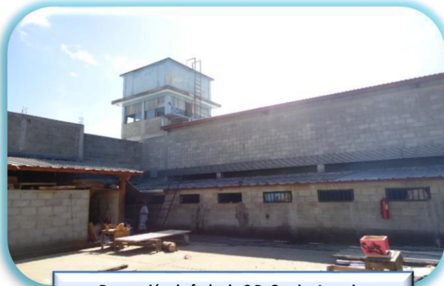
Reparación de fachada C.P. Gracias Lempira