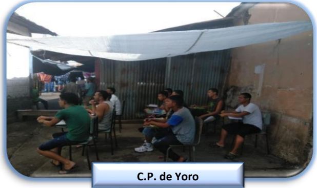
C.P. de Yoro