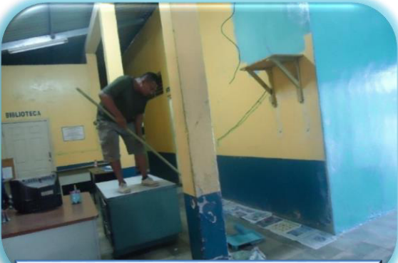
Pintado recinto general C.P. de Danlí

Se realizaron obras de construcción y reparaciones en los centros penitenciarios como parte de mejoramiento continuo de las instalaciones en los establecimientos penitenciarios