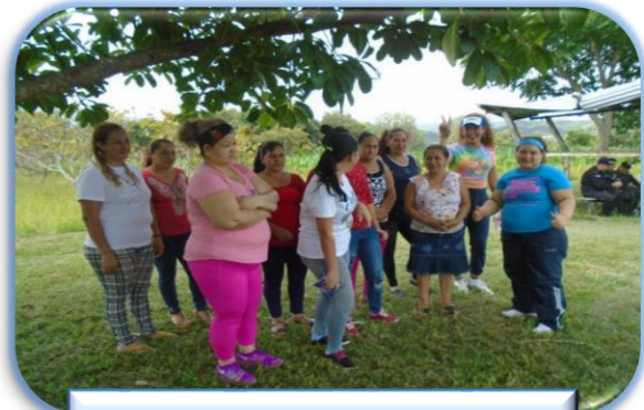
Aeróbicos en C.P. Gracias Lempira