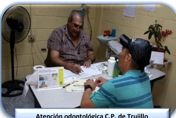
Atención odontológica C.P. de Trujillo