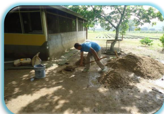
Reparación de cocina de personal de seguridad C.P. de DANLI