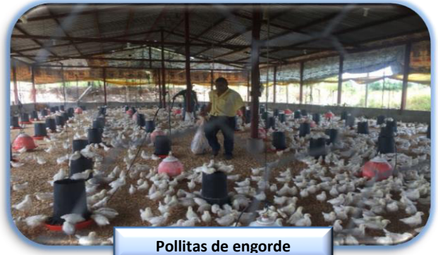
Pollitas de engorde