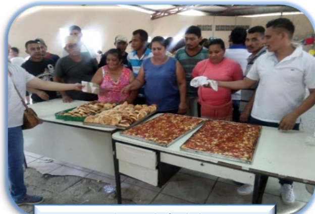
Curso de panadería Choluteca