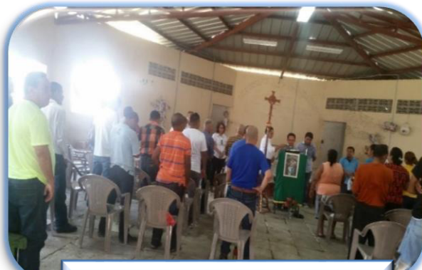
Retiro Espiritual C.P. de Choluteca

Una de las actividades que tiene mayor participación es la congregación a las diferentes iglesias que tienen presencia a nivel nacional, así como el desarrollo de actividades culturales, con 9,362 participantes el periodo.