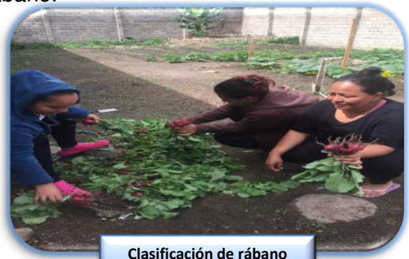
Clasificación de rábano