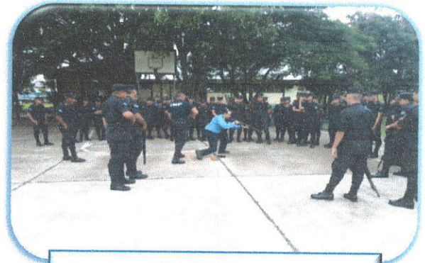
Manejo de armas