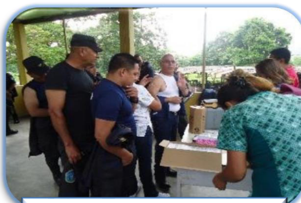
Jornada de vacunación C.P. de Danli