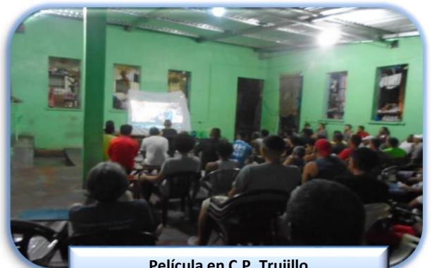
Película en C.P. Trujillo