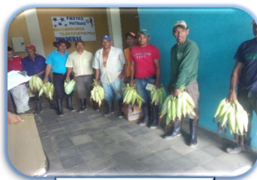
Cosecha de maíz