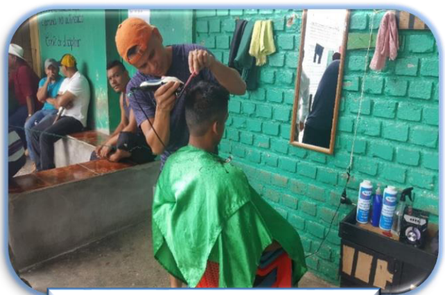
Taller de Barbería C.P. de Danlí