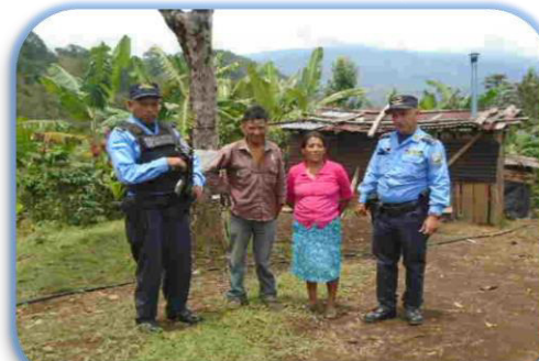
Visita domiciliaria La Paz