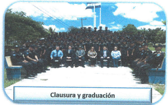
Clausura y graduación