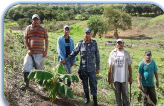
Cultivo de plátano