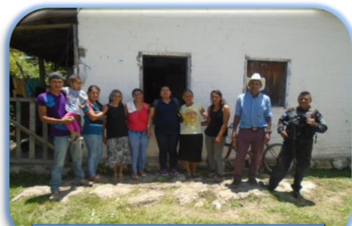
Charla sobre pre liberación Intibucá