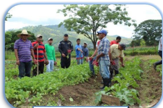
Cultivo de Rábano

Se lleva a cabo proyecto de viveros de plantas de café, cultivo de frijol, maíz, cebolla, rábano, donde los internos involucrados aprenden los procesos desde preparación de la tierra hasta la comercialización de los productos.