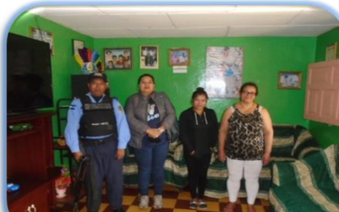
Estudio Socioeconómico San Nicolás Intibucá