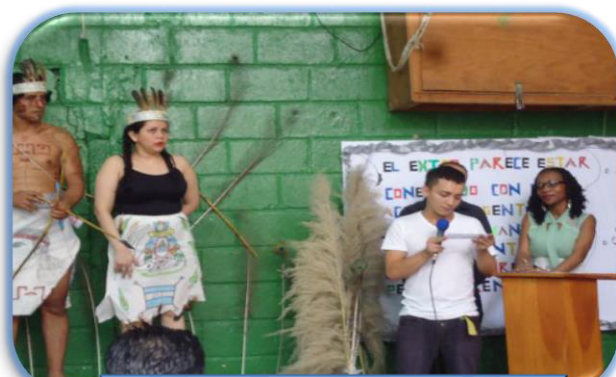
Celebración del día del indio Lempira en C.P. de El Porvenir Atlántida