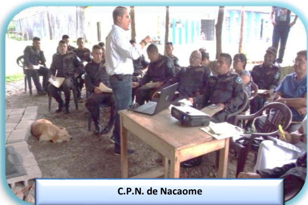
C.P.N. de Nacaome

Con el fin de sensibilizar a los funcionarios que laboran en los diferentes establecimientos penitenciarios acerca de su papel particular en la promoción y la protección de los derechos humanos, se realizaron talleres en los que participaron 140 empleados administrativos y operativos en talleres de Derechos Humanos en los Centros Penitenciarios de Nacaome, Choluteca, Morocelí.