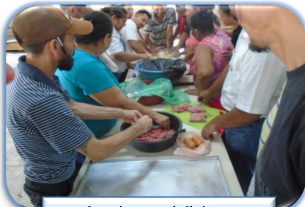
Curso de repostería Choluteca