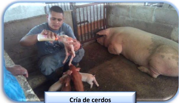
Cría de cerdos

Se continúa con la ejecución de los proyectos de Aves de postura, cría y engorde de Cerdos y Manejo de Viveros Forestales.