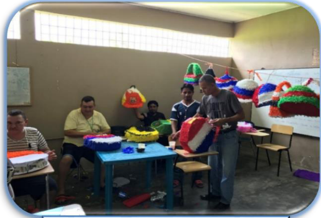
Taller de piñatería el Progreso Yoro