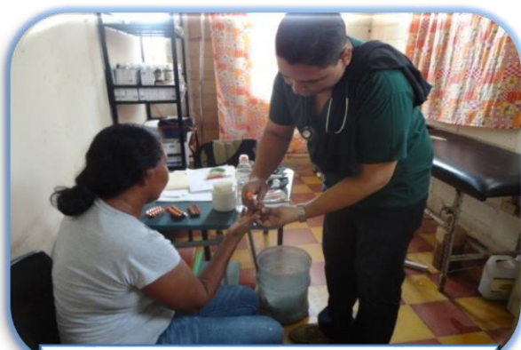
Atención médica C.P. de Nacaome

En el tercer trimestre se brindaron 43,743 atenciones Médico-Odontológicas en los centros penitenciarios a nivel nacional, 39,532 atenciones médicas y 4,211 atenciones odontológicas , acumulando a septiembre 130,019 atenciones de las cuales 116,361 médicas y 13,658 odontológicas.