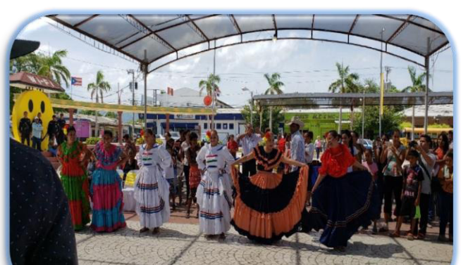
Presentación de cuadro de danza de C.P. de Choluteca