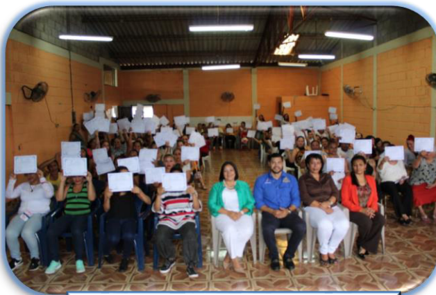
Entrega de diplomas en PNMAS

Para el tercer trimestre participaron en diferentes cursos 786 Internos , acumulando un total de 1,272 con la colaboración del INFOP y Organizaciones No Gubernamentales.