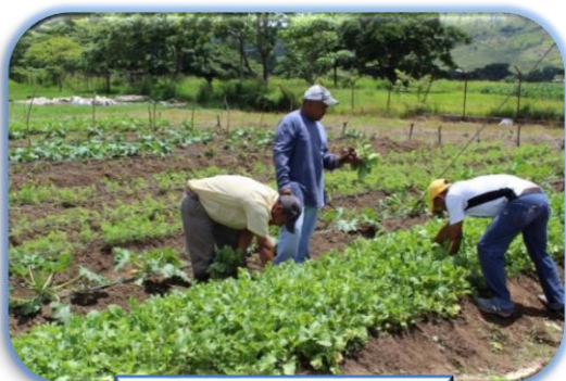
Cultivo de Hortalizas

Se realizaron Cultivos de Plátano, Yuca, Pepino, Maíz, rábano, hortalizas, donde los privados de libertad aprenden como cosechar vegetales y legumbres.