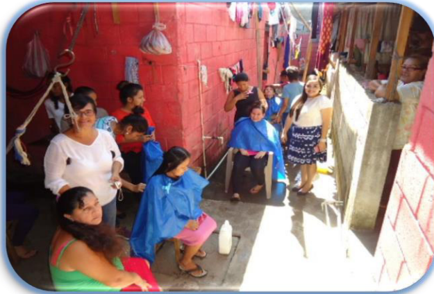
Taller de belleza Gracias Lempira