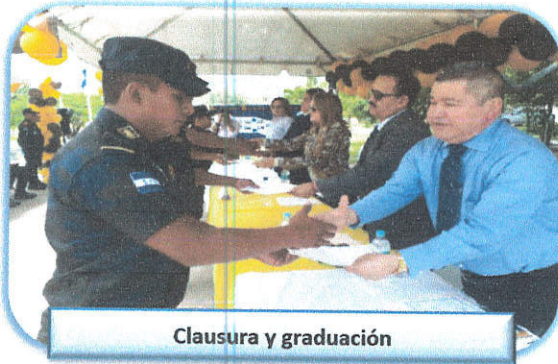
Clausura y graduación