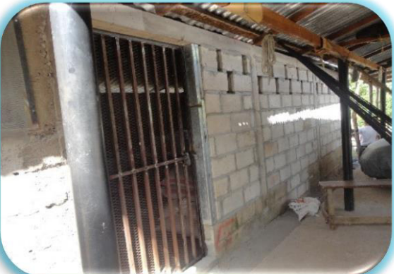
Construcción de bodega de alimentos C.P. de Nacaome