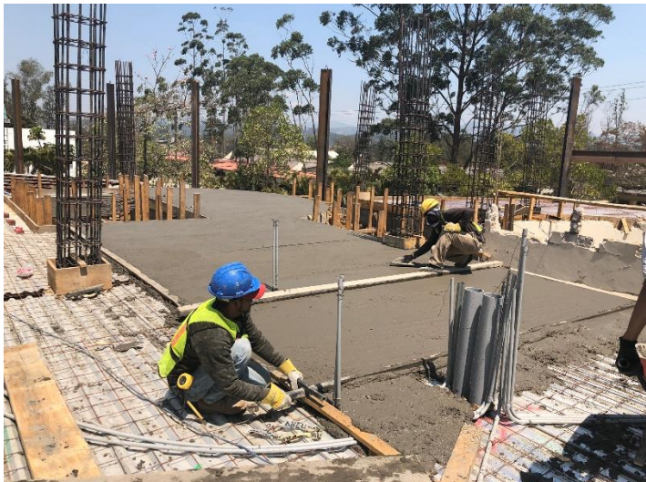
Imagen 9. Fundición de Losa de Primer Nivel