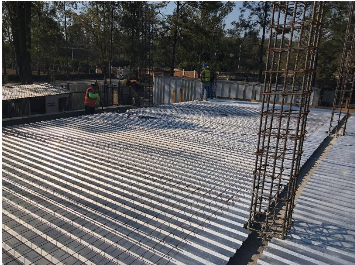
Imagen 8. Armado de Losa de Entrepiso