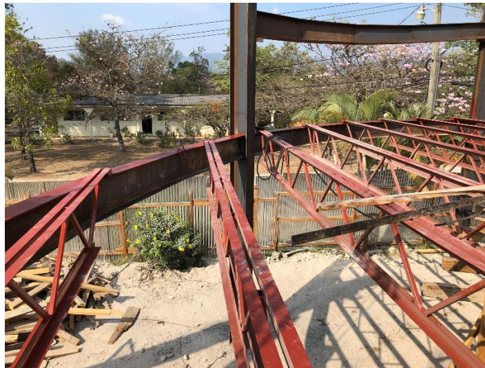
Imagen 9. Soldado y colocación de Joist sobre Vigas Metálicas

Al mismo tiempo se realizaron las actividades instalación de Joist de Ángulo Metálicos J-1, J-2, J-3, los cuales van empotrados con pernos en las vigas de concreto. (Imagen 9 y 10).