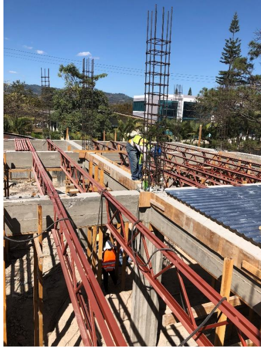
Imagen 9. Soldado y colocación de Joist sobre Vigas de Concreto