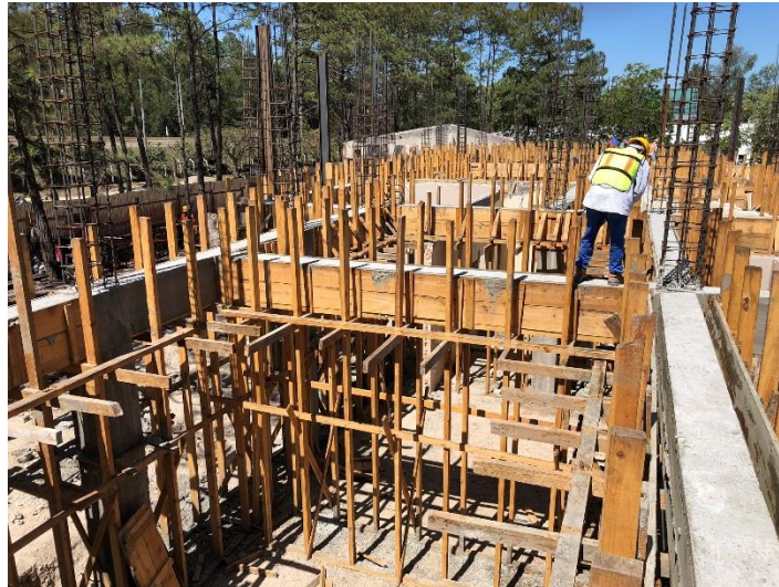
Imagen 6. Fundición de Vigas

FUNDICIÓN DE LOSA DE ENTREPISO 1 CONCRETO DE 7.5 CMS DE ESPESOR CON MALLA ELECTROSOLDADA 6/6, LAMINA ALUZINC CAL 24. (DEFINICION Y ALCANCE).