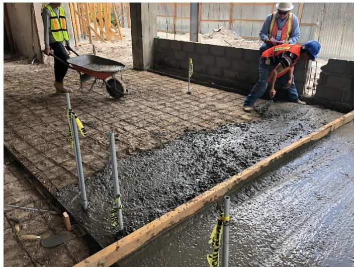
Imagen 4. Fundición de Firme de Concreto