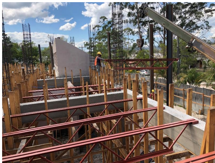
Imagen 5. Fundición de Vigas

Una vez finalizada el encofrado y armado de las Vigas, inició la fundición con hormigón 4000 psi realizada con mixer y bomba. (Imagen 5 y 6).