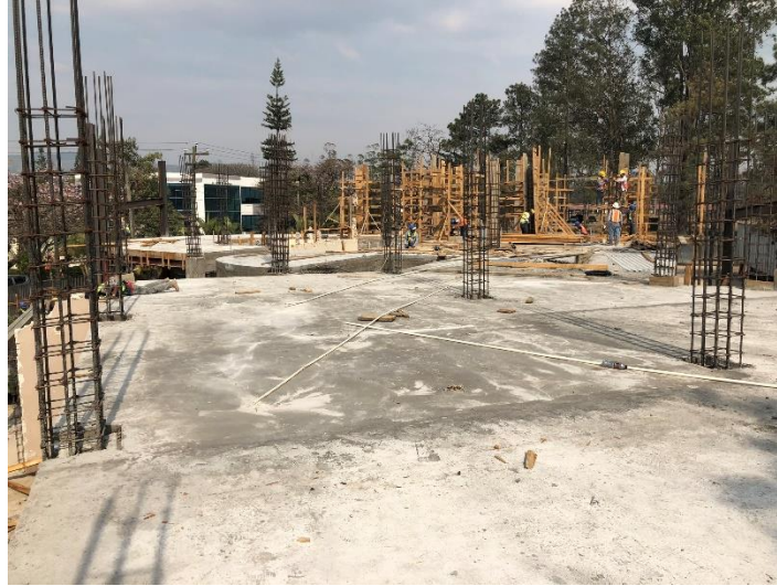
Imagen 10. Losa del Primer Nivel Fundida