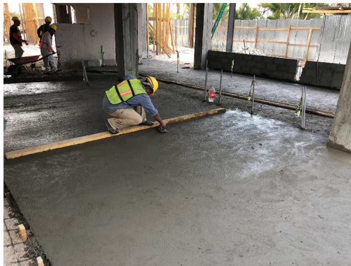
Imagen 3. Fundición de Firme de Concreto

Una vez finalizada la fundición de vigas y el compactado de material selecto, procedió la fundición de firme de concreto. (Imagen 3 y 4)