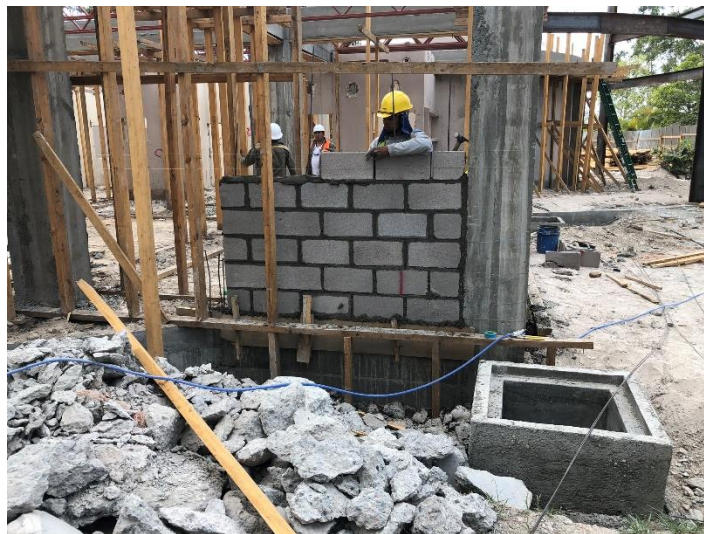
Imagen 2. Levantamiento de Paredes de Bloque