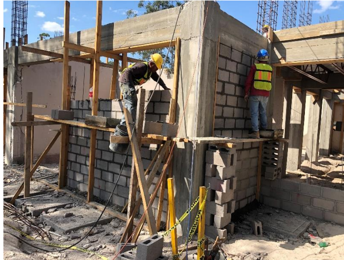
Imagen 1. Levantamiento de Paredes de Bloque

Una vez finalizada la fundición de vigas procedió el levantamiento de paredes de bloque de 4". (Imagen 1 y 2)