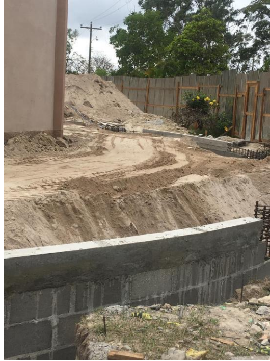
Imagen 1. Relleno y Compactado de Material Selecto