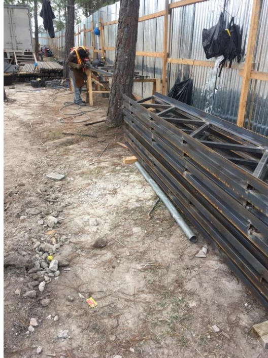
Imagen 15. Armado de Joist