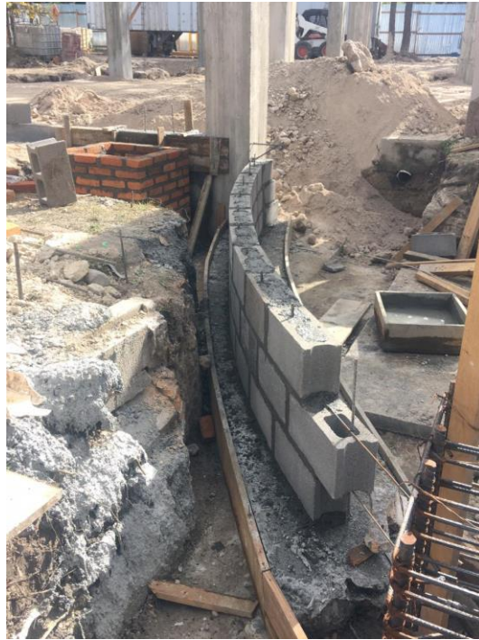
Imagen 7. Sobreelevación de Bloque