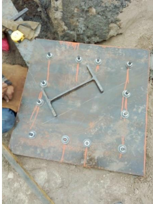
Imagen 14. Placas Metálicas con pernos