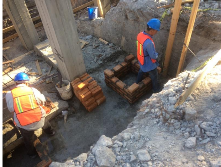
Imagen 16. Construcción de Cajas de Registro

Una vez concluidas las excavaciones, se procedió al levantamiento y construcción de las nuevas cajas de aguas negras que servirán como puntos de inspección de las nuevas instalaciones sanitarias, además de el suministro e instalación de tubería de 4" entre cada caja de registro de aguas negras. (Imagen 16 y 17)