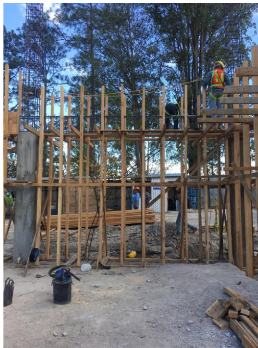
Imagen 12. Piloteado para Viga V-1

Una vez finalizada la fundición de las columnas C-1 del primer nivel, se procedió al piloteado de las Vigas V-1, colocando cada pilote a 0.60 m de distancia entre sí. Al momento de acabar esta actividad continuó el encofrado de la sección de la viga 0.55MLX 0.30ML. (Imagen 12 y 13)