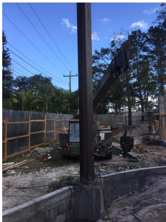
Imagen 14. Instalación de Columnas W 14x48