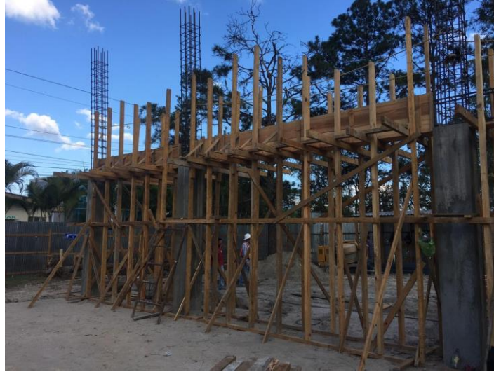
Imagen 13. Encofrado para Viga V-1