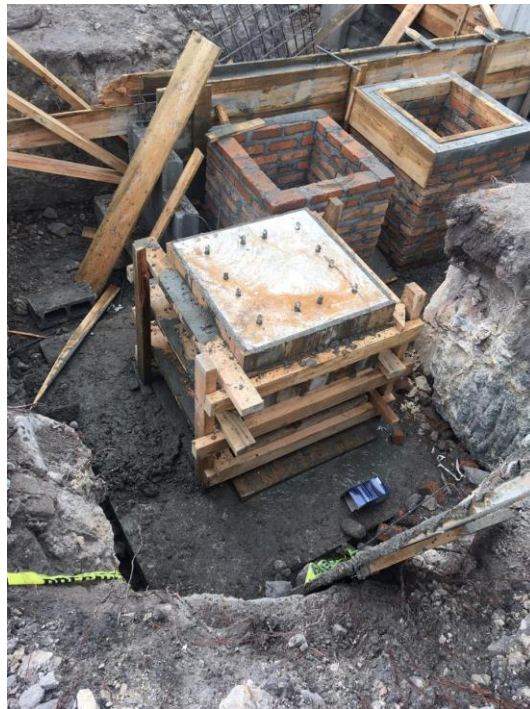
Imagen 6. Fundición de Pedestales