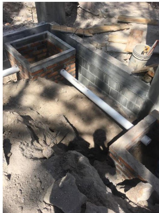
Imagen 16. Construcción de Cajas de Registro