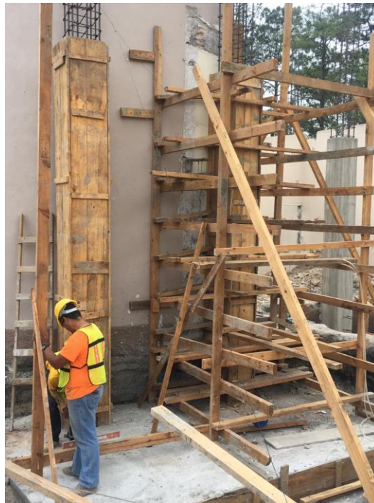
Imagen 9. Encofrado de Columnas C-1

Continuó y finalizaron las fundiciones de las columnas C-1 del primer nivel. Esta actividad se realizó con camión mixer tal y como las especificaciones contractuales lo requiere, concreta resistencia 4000 PSI. Una vez en su puesto se hizo de nuevo la verificación que la distancia entre ejes fuera la correcta según planos contractuales.