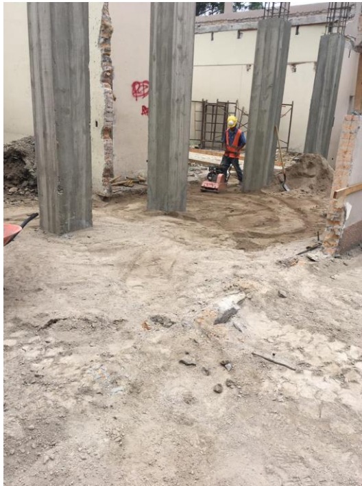
Imagen 3. Relleno y Compactado de Material Selecto para Zapatas Aisladas y Corridas.