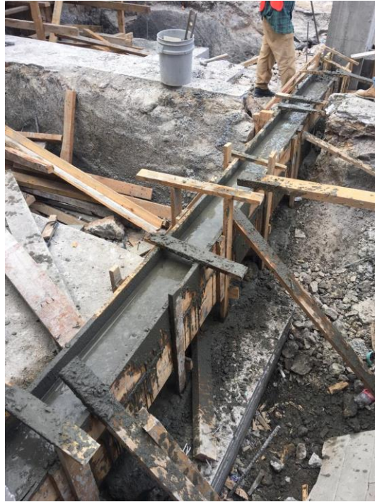
Imagen 5. Fundición de Viga Tensora