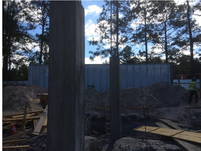
Imagen 11. Columnas Fundidas C-1