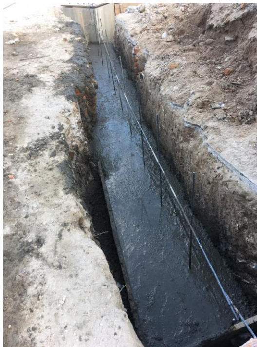
Imagen 4. Fundición de Zapata Aislada

Una vez concluidas las excavaciones de zapata aislada y corrida, comenzó la actividad de armado, encofrado y fundición de las Zapatas Aisladas, Viga Tensora y Pedestales. Una vez finalizadas estas actividades procedió la fundición de Zapata Corrida y el levantamiento de la sobreelevación para que de esta manera continuara la actividad de fundición de solera de humedad, todo esto conforme a los planos estructurales y especificaciones técnicas. (Imagen 4, 5, 6, 7 y 8)