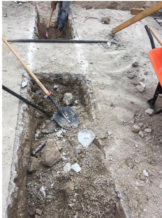
Imagen 2. Excavación para Zapata Corrida

Después de definidos los ejes mediante el marcado, trazado y niveleteado (Imagen 2), se continuó la excavación de zapatas aisladas de todo el edificio, encontrando terreno tipo duro a una profundidad de 1.00 ml, promedio. Esta actividad se realizó con mano de obra como se muestra en las imágenes.