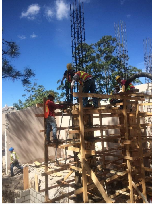
Imagen 10. Fundición de Columnas C-1