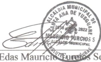
Edas Mauricio Ferrer Servellon Alcalde Municipal