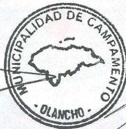
Ligia Cleotilde Morales Cáceres