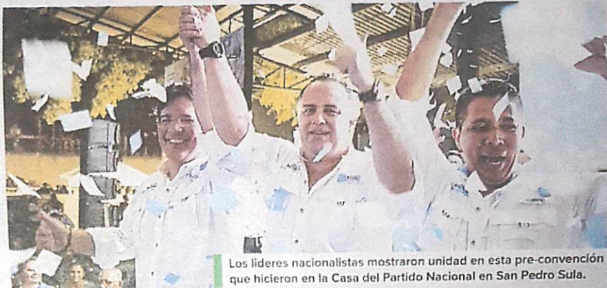
Los líderes nacionalistas mostraron unidad en esta pre-convención que hicieron en la Casa del Partido Nacional en San Pedro Sula.

Calidonio durante su discurso manifestó que "hoy estamos en una pre convención y estamos demost-