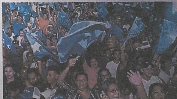
Los correligionarios nacionalistas mostraron su apoyo al alcalde y representantes del Partido.