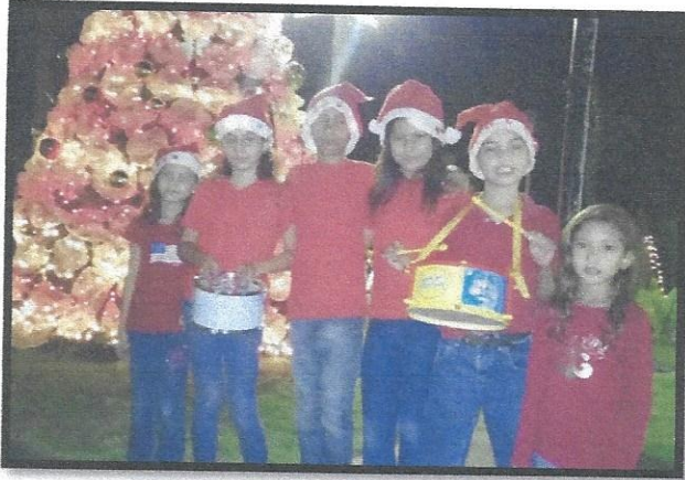
Estudiantes del CEB Lempira listos para participar en la noche cultural navideña.