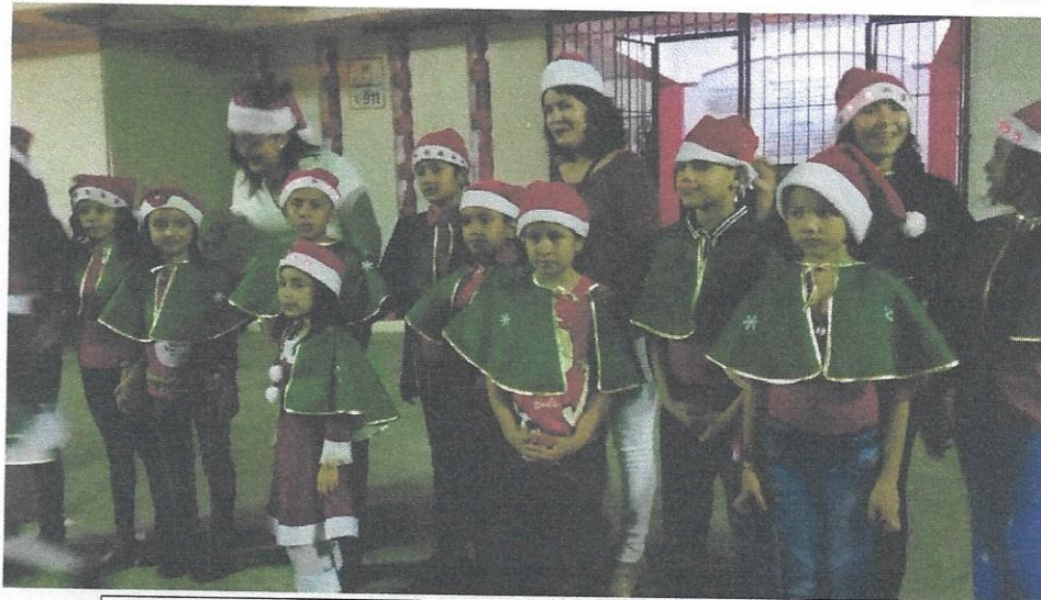
Estudiantes del CEB. Augusto C. Coello listos para participar en el evento del encendido del árbol.