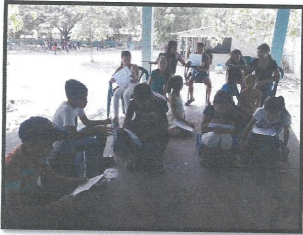
Estudiantes del CEB. Augusto. C. Coello en sus prácticas diarias para el evento navideño.