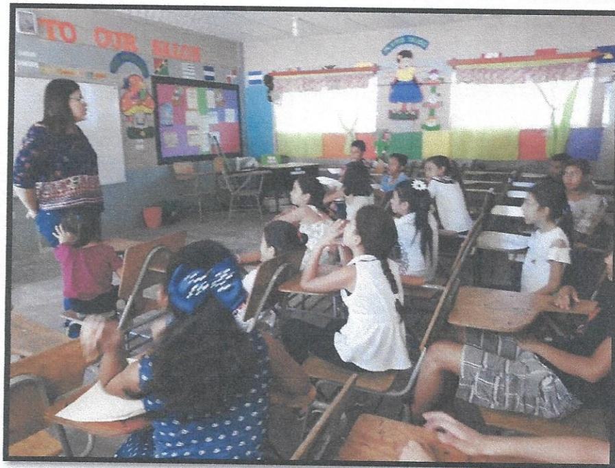
Directora del programa bilingüe ensayando los estudiantes del CEB. Augusto C. Coello.