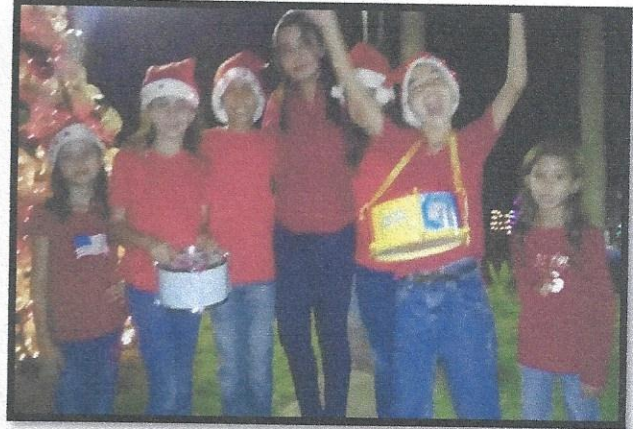
Grupo de estudiantes alegres y felices después de participar en el evento navideño.