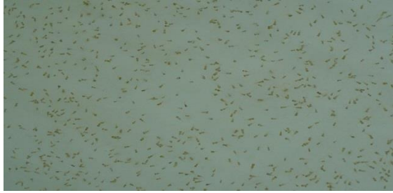
Alevines producidos en el Centro Piscícola El Carao