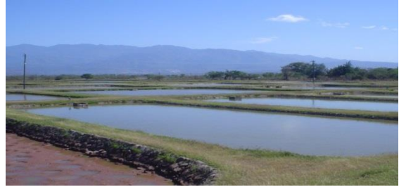
Estancos del Centro Piscícola El Carao