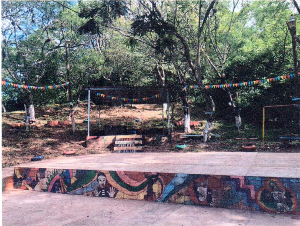
Ilustración de Jornada de trabajo

En Las Instalaciones del programa COMNVIDA