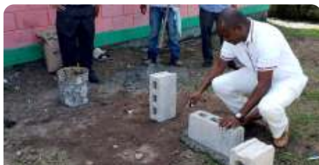
Colocación de Primera Piedra Kinders Porfirio Ruiz Col. Prados de la Misericordia