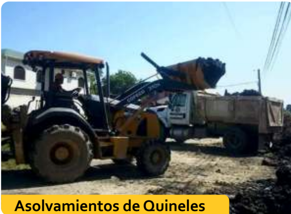
Asolvamientos de Quineles

Una de sus funciones primordiales es el de atender las emergencias que enfrenen los ciudadanos en condiciones de fenómenos naturales, realizan labores de prevención, conformación de comité locales de emergencia (CODELES)