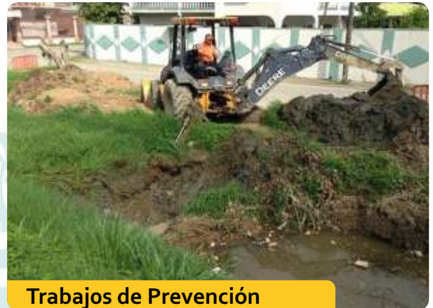
Trabajos de Prevención