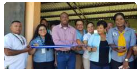
Corte de Cinta Inaugural de la Oficina Municipal de la Vivienda