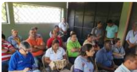
Parte de la Asistencia al evento