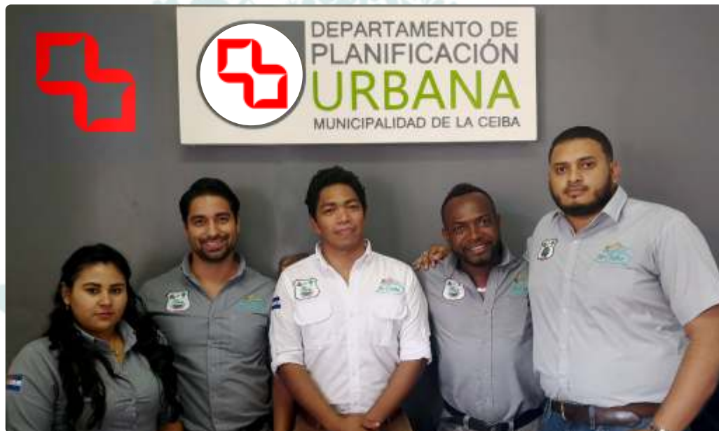
EQUIPO DE COLABORADORES ( Izquierda a derecha. )

Nuestro Enfoque: No pretendemos desarrollar una ciudad Utópica, sino que ante lo que está sucediendo en la actualidad poder prever lo que podría pasar y a partir de ello organizar estrategias urbanas adecuadas en beneficio de la sociedad, situando a las personas como prioridad antes que las estructuras de construcción.