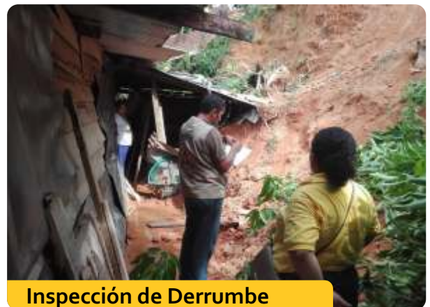
Inspección de Derrumbe