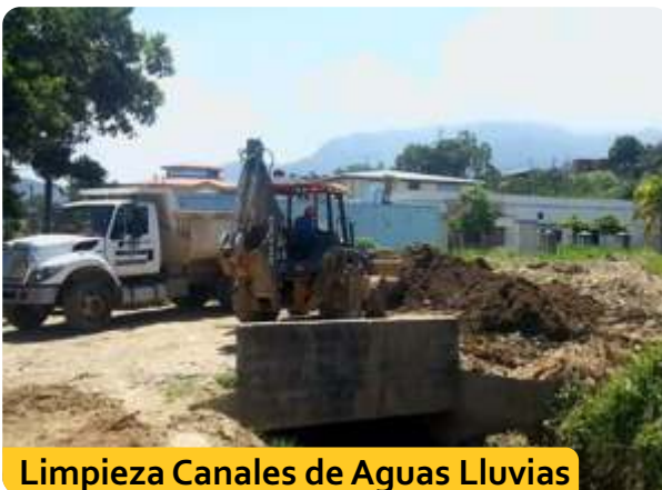
Limpieza Canales de Aguas Lluvias