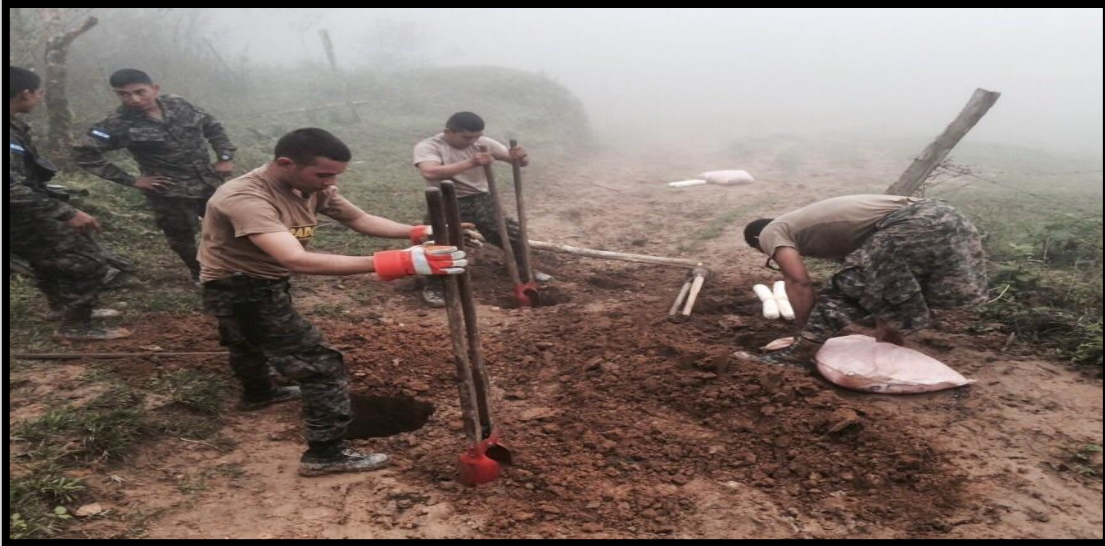
Destrucción de narcopistas y puntos en La Mosquitia