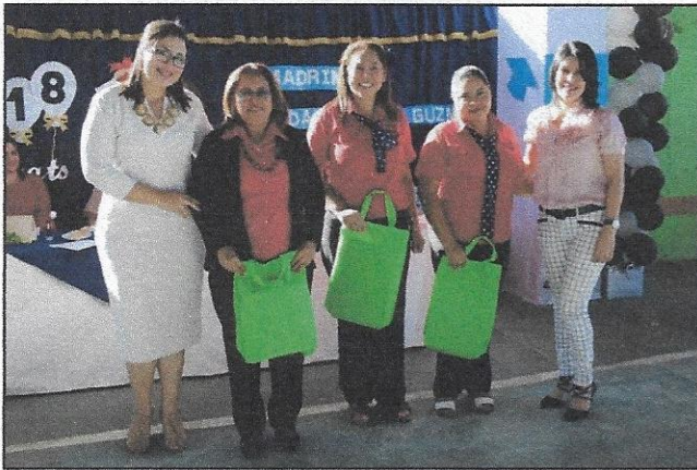
DOCENTES DEL C.E.B. AUGUSTO C. COELLO