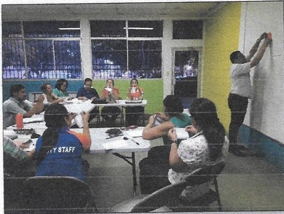
Presentación final por docentes del C.E.B Lempira