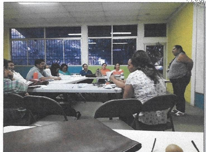
Docente del C.E.B. Lempira haciendo su presentación final.