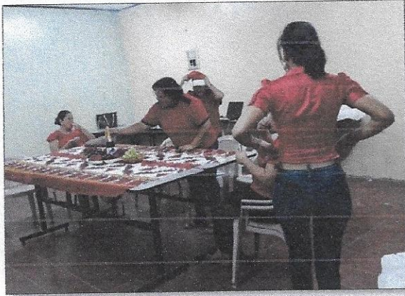
Presentación final por docentes del C.E.B Gabriela Mistral