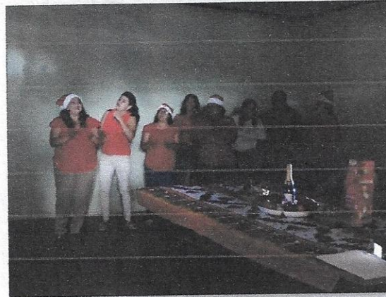
Coro navideño, parte de la presentación final de los docentes del C.E.B. Gabriela Mistral