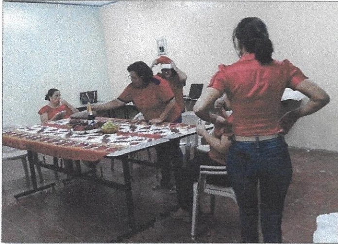
Presentación final por docentes del C.E.B Gabriela Mistral