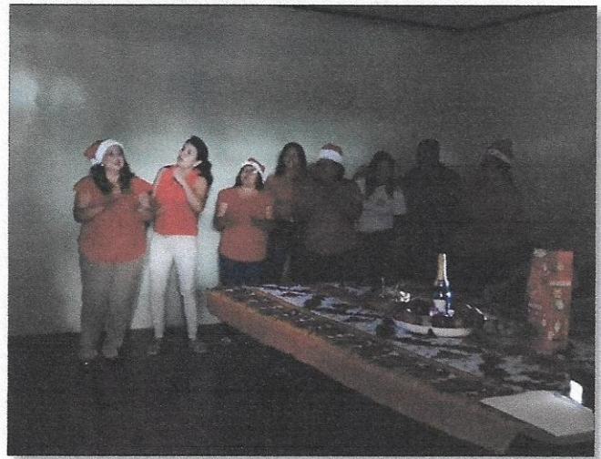
Coro navideño, parte de la presentación final de los docentes del C.E.B. Gabriela Mistral