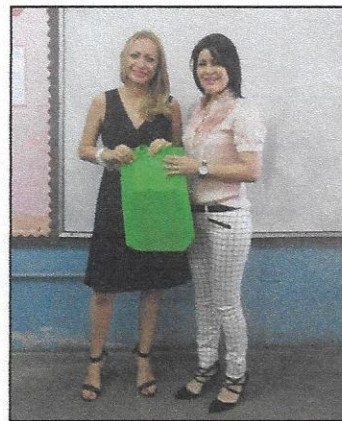
DOCENTE DEL C.E.B. LUIS BOGRÁN