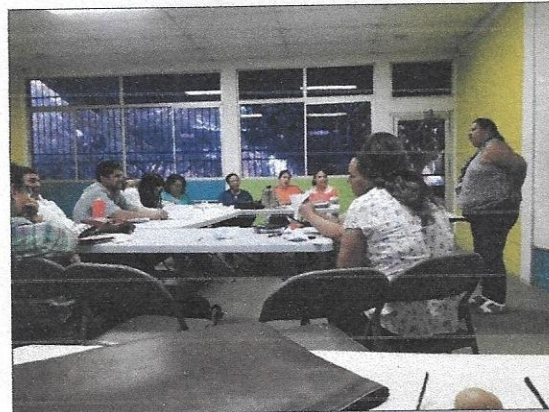
Docente del C.E.B. Lempira haciendo su presentación final.