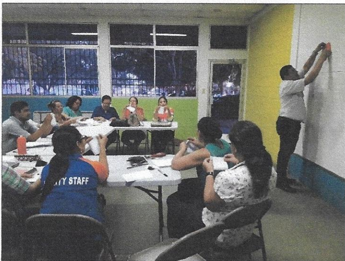
Presentación final por docentes del C.E.B Lempira