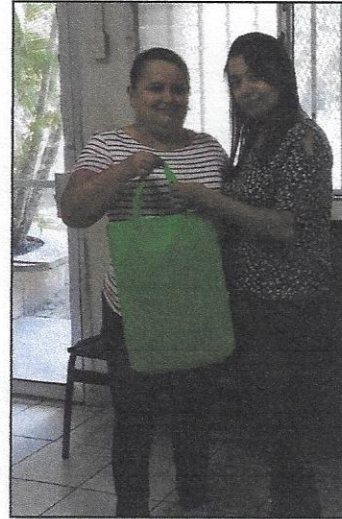
DOCENTES DEL C.E.B. LEMPIRA