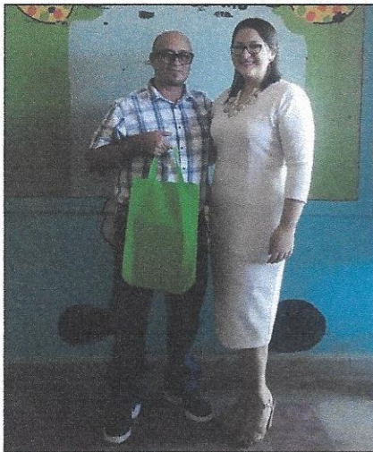
DOCENTES DEL C.E.B. FRANCISCO MORAZÁN