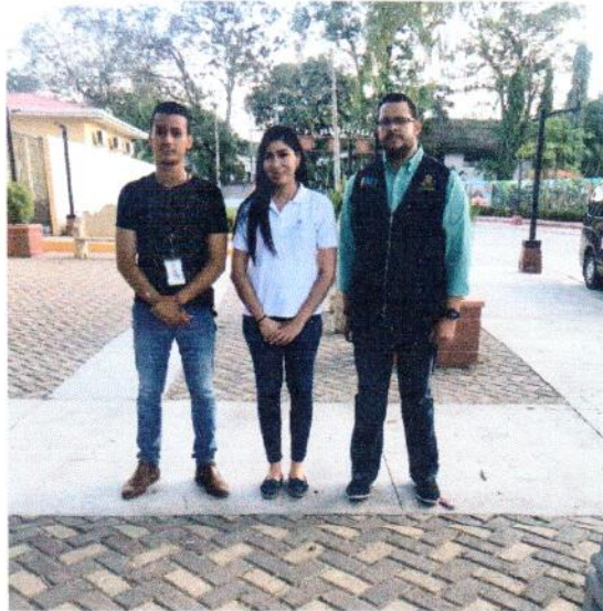
OMJ en la Lima, Cortes