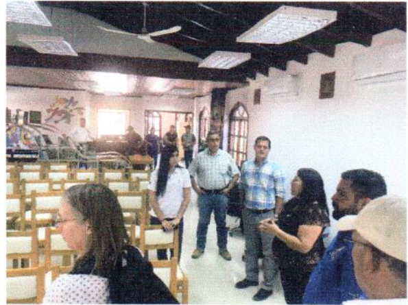
Biblioteca casa de la juventud