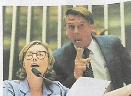
ABUSO. La diputada María do Rosario y Jair Bolsonaro en julio de este año en una comparecencia pública.

"Con lo que nos ocurre como mujeres, con lo que ocurrió conmigo... nuestra preocupación es que haya legitimidad para más violencia" si gana Bolsonaro, dijo la legisladora. "Brasil es campeón de violencia contra mujeres", recordó. Según la ONG Foro Brasileño para la Seguridad Pública, en 2017 se cometieron 4.473 asesinatos de mujeres y 60,018 violaciones, un 6% y un 8% más que en 2016.