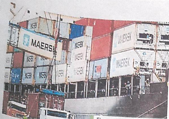
El panorama será grave señalan organismos.

Además el FMI pronostica que la aguda depreciación de la moneda, que suma una caída de 50% frente al dólar este año, provocará un alza de los precios de 31.8% en 2018 y de 31.7% el año siguiente. AFP