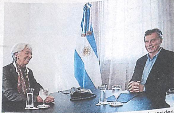
Foto de archivo: Christine Lagarde del FMI reunida con el presidente de Argentina Mauricio Macri.

El funcionario deberá supervisar la aplicación del plan de ayuda para el país, fruto de una negociación en la cual el gobierno se comprometió a obtener un déficit fiscal cero