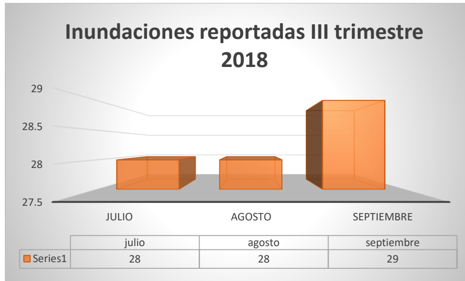
Nota: Grafico Comparativo de Servicios de rescate III Trimestre datos obtenidos de estadísticas del Cuerpo de Bomberos de Honduras

Por la parte de los incidentes de las inundaciones son unas de las emergencias de mayor frecuencia a nivel de nacional, es por lo que el Cuerpo de Bomberos es la institución llamada y capacitada para hacer frente a este tipo de emergencias. Cabe mencionar que por diferentes razones tales como lluvias intensas, la gravedad de la región y los fenómenos naturales que se presentan, son orígenes para que los Bomberos tengan que atender estos tipos de emergencias. En el caso de las Inundaciones para este primer trimestre, no se presentan este tipo de servicio, ya que no es temporada de invierno ni de lluvia es por lo que no se tiene registrado ningún tipo de servicio de rescate en base a inundaciones.