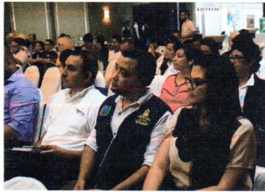
2. Feria con Stand Institucional (28.09.2018); CEB Monseñor Fiallos; evento organizado por el Proy. Asegurando la Educación USAID.