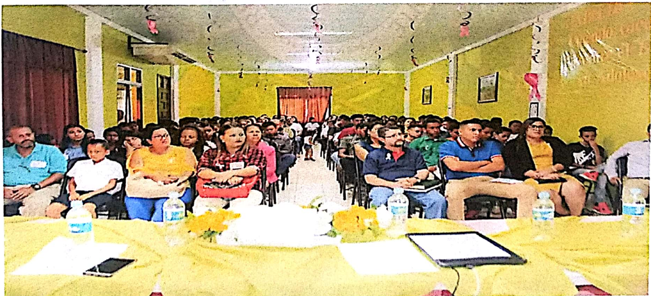
Ciudadanos que asistieron al Cabildo Abierto Municipal sobre el tema: Prevención de Embarazos en Adolescentes.