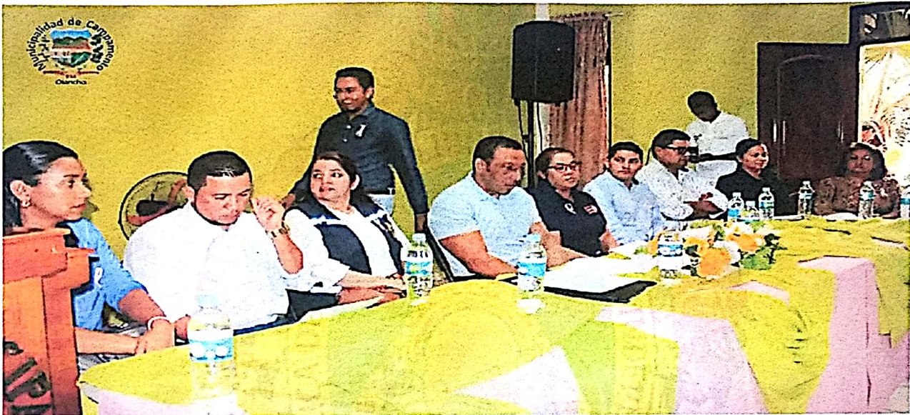
Miembros que conforman la Mesa Principal del Cabildo Abierto Municipal “Prevención de Embarazos en Adolescentes”