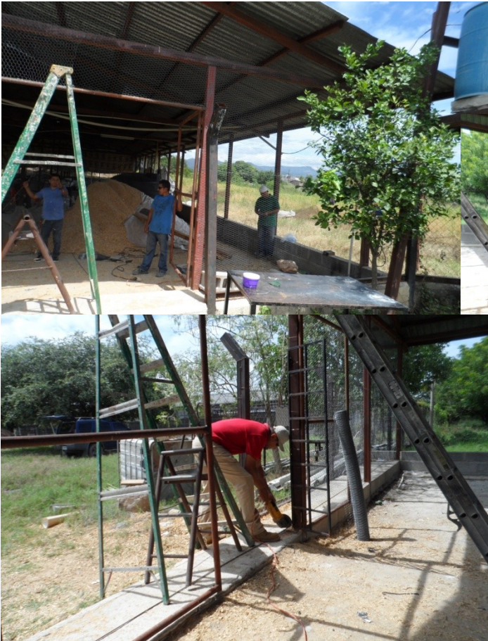
calentadoras para la pollita

1) Cambio total de malla gallina, pues estaba totalmente deteriorada.