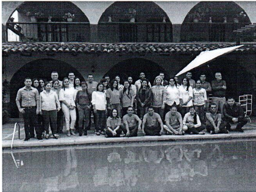
FERIA DE SALUD- Instituto INTAE/ UDHJ