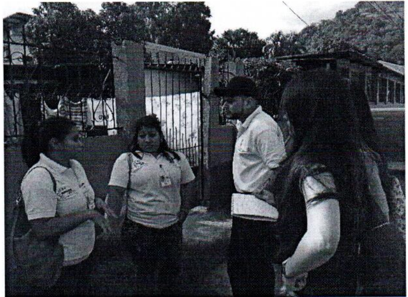
TRABAJO DE CAMPO HONDURAS JOVEN ATLÁNTIDA