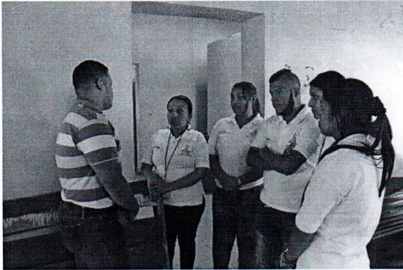
TRABAJO DE CAMPO HONDURAS JOVEN TEGUCIGALPA