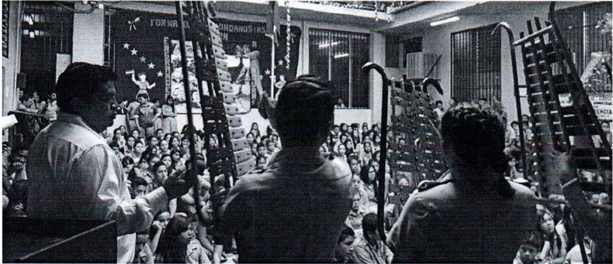
EVENTO-ESTADIO VIRTUALES / Tegucigalpa/UDHJ