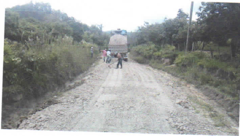
El material fue trasladado en volquetas