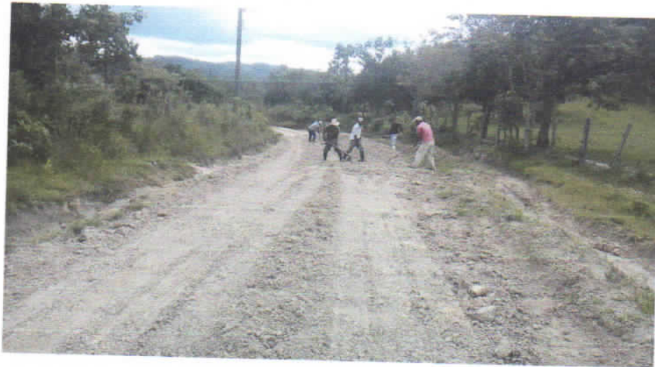
Regado del material utilizando pala y colaboración humana.