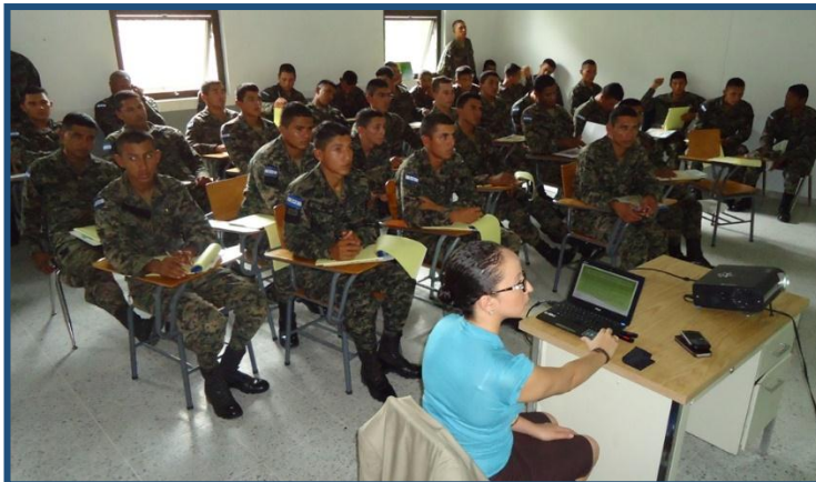
Capacitación sobre los Derechos Humanos

Se han formado en materia de Derechos Humanos 4,906 personas , de las cuales 1,245 pertenecen a las Fuerzas Armadas, 350 son agentes penitenciarios, 143 policías municipales, 1,431 funcionarios (as) públicos, 1,068 personas privadas de libertad.