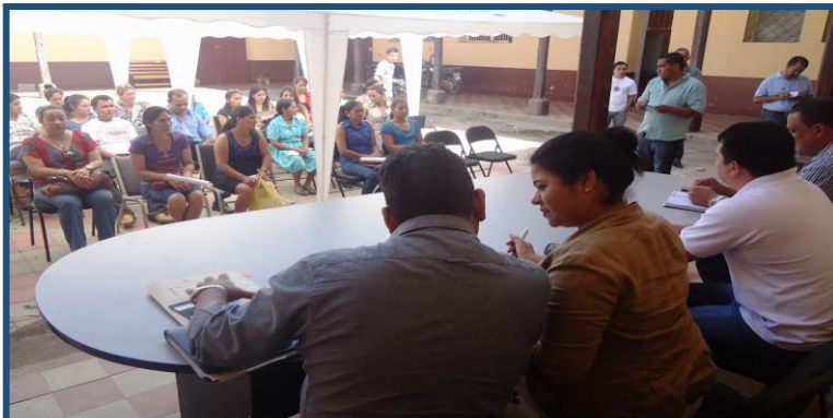
Entrega en capital semilla a grupos de mujeres

Se organizaron Grupos de Mujeres (Proyectos Productivos) beneficiados con un total de L.300 mil para capital semilla, estos son fondos destinados a proyectos productivos, de los cuales son entregados 25,000 lempiras a cada proyecto o grupos de mujeres organizados. Previo a la presentación y aprobación de los perfiles.