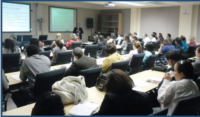
Capacitación de la Dirección General de Políticas Públicas de los Derechos Humanos y Justicia

Se han formado en materia de Derechos Humanos 4,906 personas , de las cuales 1,245 pertenecen a las Fuerzas Armadas, 350 son agentes penitenciarios, 143 policías municipales, 1,431 funcionarios (as) públicos, 1,068 personas privadas de libertad.