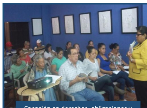
Capacitación en derechos, obligaciones y prohibiciones en materia de

También se logró la resolución del 78% de conflictos de inquilinato por la vía conciliatoria y se capacitó a dueños de negocios e inquilinos en aspectos fundamentales de la Ley de Inquilinato.