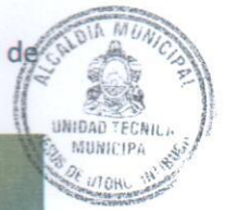
Socialización de proyecto de agua potable comunidad de casa viejas, aldea san Rafael, Jesús de Otoro, Intibucá.