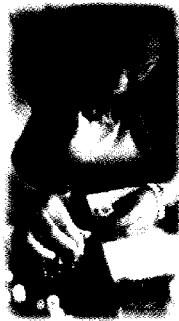
Fotografía I " Promotora brindando el Taller"