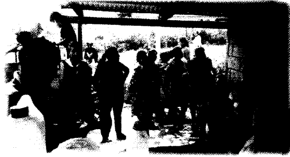
Fotografía II " Pobladores participantes del Taller"