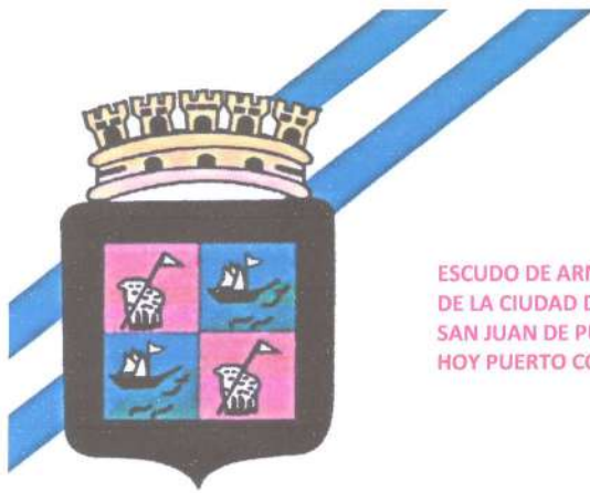
ESCUDO DE ARMAS DE LA CIUDAD DE SAN JUAN DE PUERTO CABALLOS HOY PUERTO CORTÉS