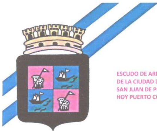
ESCUDO DE ARMAS DE LA CIUDAD DE SAN JUAN DE PUERTO CABALLOS HOY PUERTO CORTÉS