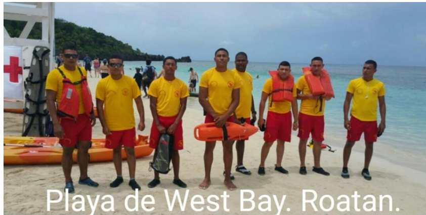
Playa de West Bay. Roatan.