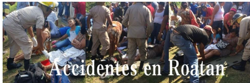
Accidentes en Roatan