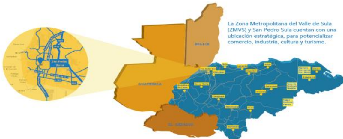
Plan Maestro de Desarrollo Municipal de San Pedro Sula

Habrán 5 Mercados Zonales: Chamelecon, Pradera, Rivera Hernández, Fesitránh y Cofradía; Mercado La Gran Terminal; Mercado del Distrito Central. Son mercados puntuales que necesitamos para que la gente no tenga que llegar a un solo punto. Esos mercados zonales son mercados prácticos, no