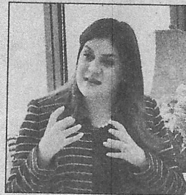
En el conclave se abordaran temas como la política migratoria regional y las acciones que se emprenderán.

Previo al encuentro entre cancilleres se realizará la LV Reunión del Comité Ejecutivo del Sistema de la Integración Centroamericana (CE-SICA).