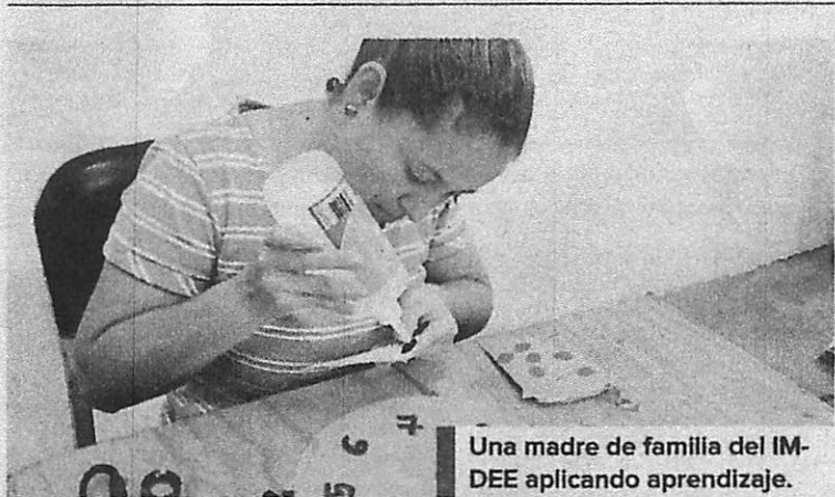
Una madre de familia del IM-DEE aplicando aprendizaje.

coronó Juan Lindo. Según el funcionario, en todos los materiales para que sean utilizados en obras. Los estudiantes serán beneficiados.