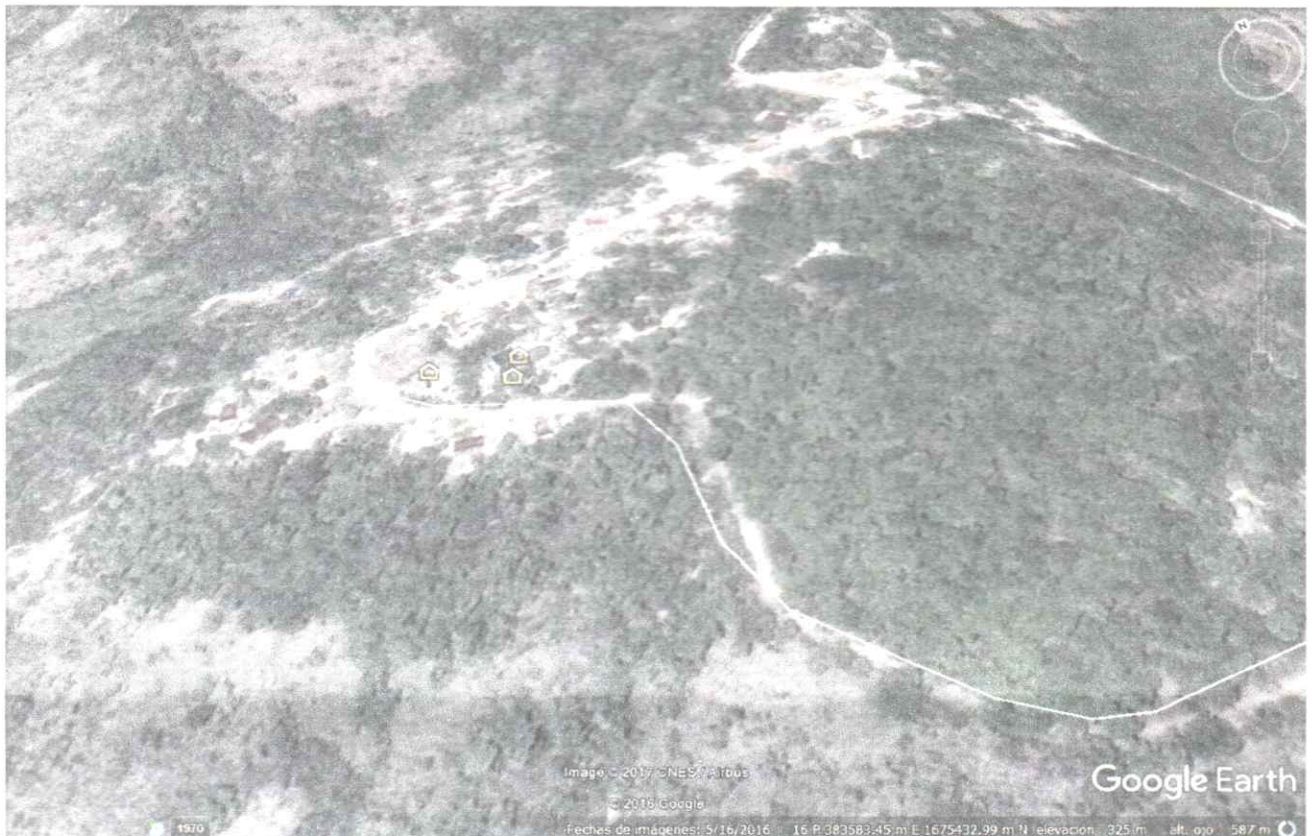
Aldea Loma Larga. San Antonio de Cortés, Cortés