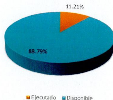
Ejecución del Presupuesto al 28 de Febrero 2015 COALIANZA