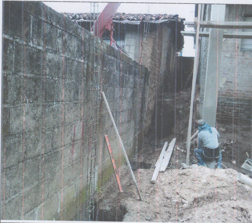
Colocacion de castillos para el muro perimetral.

INFORME MENSUAL DE PROYECTO EN EJECUCION DE PROYECTO. UNIDAD TECNICA MUNICIPAL PERIODO: 1-31 DE AGOSTO DE 2017