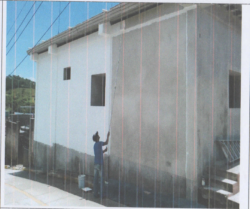
Colocación del sellador para pintura.