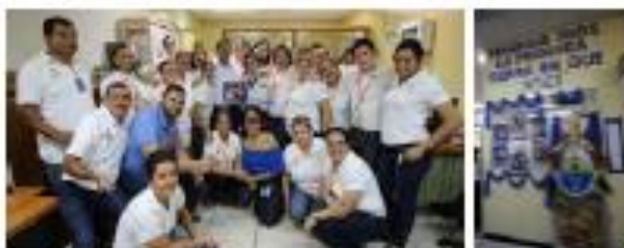
1er Lugar: Departamento de Clientes Residenciales

En la conmemoración del 196 aniversario patrio, HONDUTEL a través de la Gerencia de Negocios realizó recientemente el "Concurso de Puertas Cívicas".