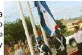
Izada de la bandera nacional por los cadetes de la Academia Militar Francisco Morazán.

Con estos actos, se da el inicio al comienzo de varias actividades a desarrollarse en el mes de septiembre en honor al 196 aniversario patrio. Desde muy tempranas horas de la mañana los empleados de la estatal telefónica se hicieron presentes con mucho fervor y patriotismo a la actividad.