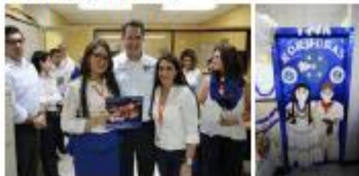
3er Lugar: Inteligencia de Negocios

Con esta bonita actividad HONDUTEL , promueve en este mes patrio nuestros valores, símbolos y toda la riqueza que enaltece nuestra Honduras .