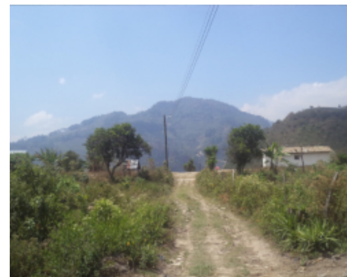
El proyecto abarca alrededor de 2.6 kilómetros lineales en la comunidad de El Tablón.