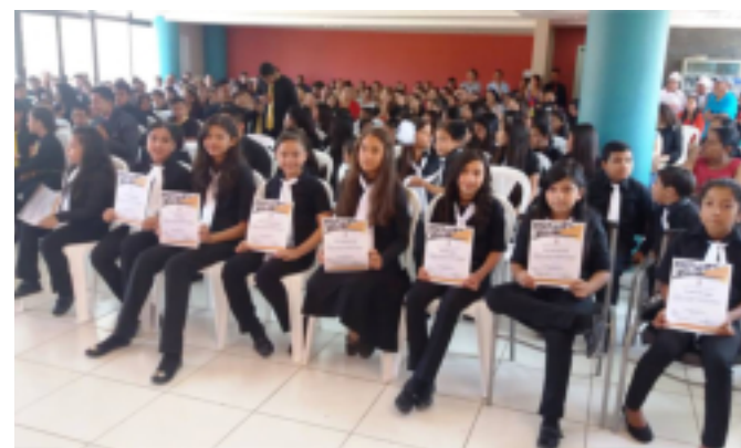
La Escuela Municipal de Música se hizo posible debido a las gestiones y el trabajo del alcalde municipal.