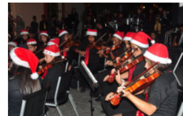
Uno de los mayores logros fue la integración de la Orquesta Municipal Infantil, que realizó diferentes conciertos.