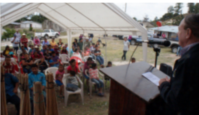
En los próximos meses, se ejecutarán más proyectos en la comunidad: servicios sanitarios, entre otros.

Comayagua, una ciudad para vivir, visitar e invertir.