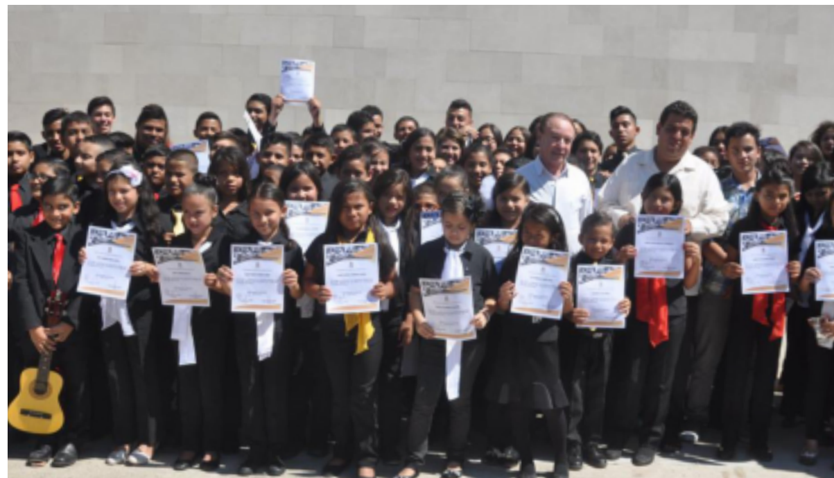
Más de 200 niños y jóvenes recibieron su certificado de finalización del Primer Ciclo Básico de la Escuela Municipal de Música.

Agregó, que a pesar del poco tiempo de funcionamiento que tiene la Escuela Municipal de Música, para la Alcaldía, padres de familia y para toda la sociedad de Comayagua, ha sido motivo de orgullo, debido a que los jóvenes han realizado grandes presentaciones públicas que generan indudablemente un impacto positivo en la sociedad, pero más que eso, genera orgullo de ser comayagüense.