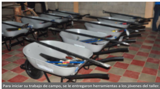
Para iniciar su trabajo de campo, se le entregaron herramientas a los jóvenes del taller.

“Para nosotros la formación de los jóvenes en el área técnica, especialmente en la zona rural, es sumamente importante, porque abrimos nuevas oportunidades; ahora que cumplieron con su proceso de formación, hacemos entrega de un equipo de herramientas básicas para que tengan lo necesario y de esta manera, ejecuten sus trabajos de albañilería y puedan generar ingresos para