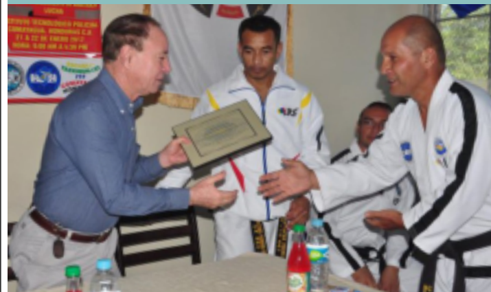
Esta distinción es otorgada a personas que apoyan incondicionalmente las artes marciales.