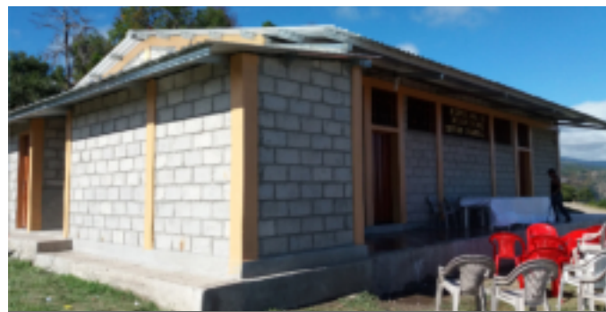
El centro comunal será el epicentro de las actividades de los pobladores de la comunidad.