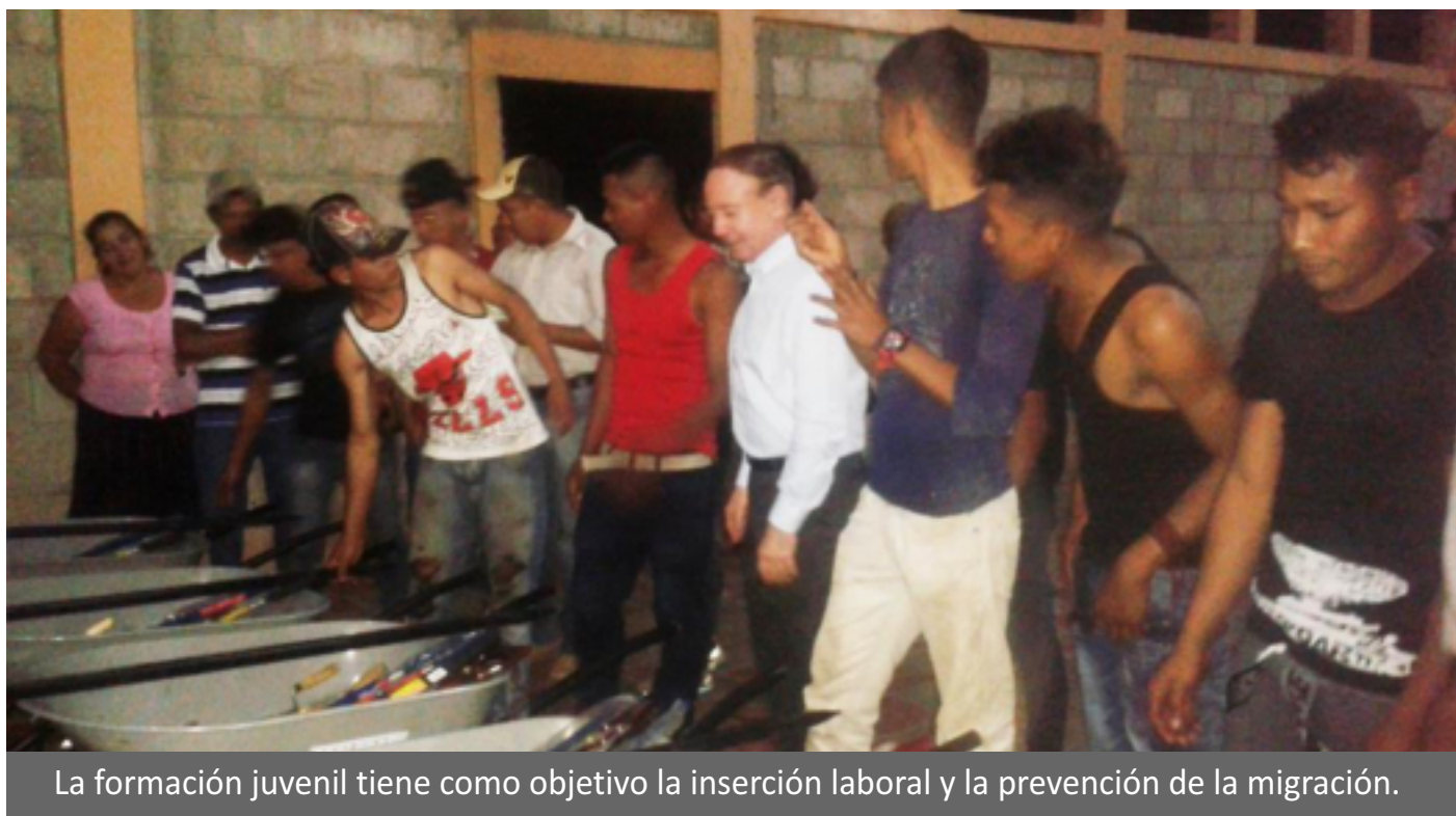
La formación juvenil tiene como objetivo la inserción laboral y la prevención de la migración.