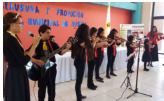
Los niños y jóvenes se desempeñaron en diversas clases: percusión, guitarra, violín, piano y flauta.