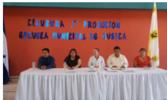
Autoridades municipales y de educación a nivel departamental, estuvieron presente en la ceremonia de clausura.

El Primer Ciclo Básico finalizó en diciembre del año pasado, ahora estarán abiertas, hasta el 3 de febrero, las matrículas para el segundo período. No tienen ningún costo, la alcaldía cubre todos los gastos y se pretende alcanzar una matrícula de 500 jóvenes que quieran aprovechar su tiempo libre aprendiendo a ejecutar guitarra, piano, violín, flauta travesa, percusión.