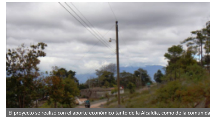
El proyecto se realizó con el aporte económico tanto de la Alcaldía, como de la comunidad.

Agregó, que la alcaldía está a punto de iniciar la construcción de un sistema sanitario, que permita mejorar las condiciones de salud de la comunidad, ya que, el desarrollo siempre es un proceso continuo y que nunca