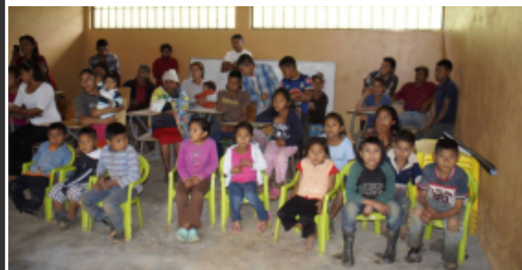
Alrededor de 30 niños y niñas son los beneficiarios de este proyecto.

Cabe destacar que esta alcaldía año con año invierte aproximadamente 20 millones de lempiras en el sector educativo, distribuidos de la siguiente manera; construcción y mantenimientos de aulas, pago a maestros, materiales didácticos, becas, bonos, etc.