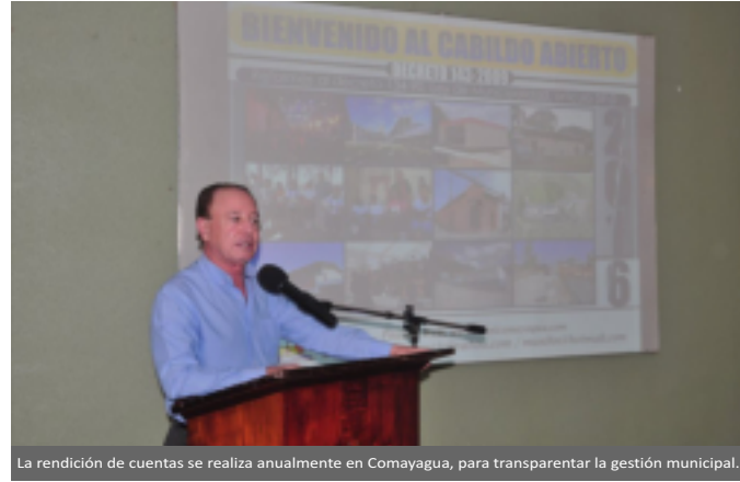
La rendición de cuentas se realiza anualmente en Comayagua, para transparentar la gestión municipal.

Además, dio a conocer uno de los proyectos más importantes para toda la población de esta ciudad en donde la Alcaldía, a través de Servicio Aguas de