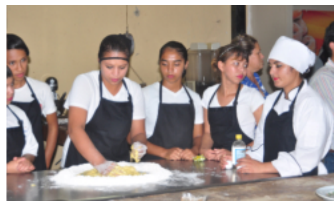
El modelo educativo de la Escuela Taller fomenta la autoempleabilidad a través de la creación de microempresas.