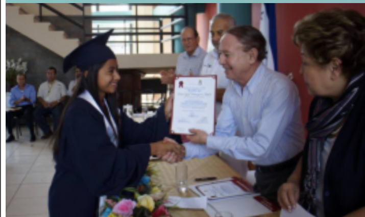
Los jóvenes egresados tendrán la oportunidad de inserción laboral en la región.