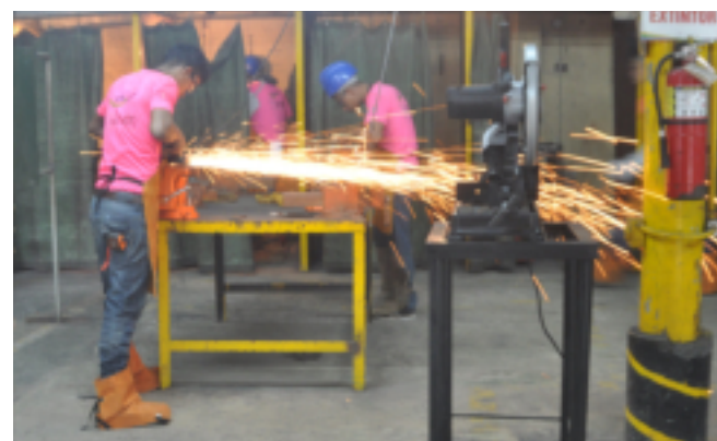
El Taller “Soldador de Obra Civil” tiene una duración de 830 horas.