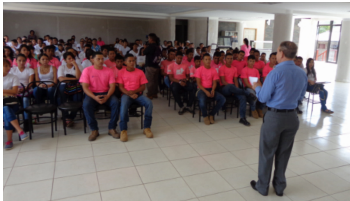
Hasta el momento se han formado más de 7,660 jóvenes, de los cuales, 2,570 se han insertado en el ámbito laboral.

Además, declaró que se están cosechando frutos de un esfuerzo que