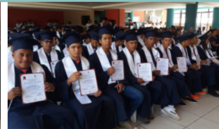
83 jóvenes se graduaron de los talleres de cocina, mecánica de motos, entre otros.