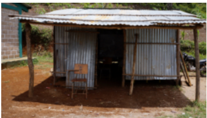
Antiguas instalaciones de lámina del kínder en la comunidad de Jardines.

Comayagua, una ciudad para vivir, visitar e invertir.