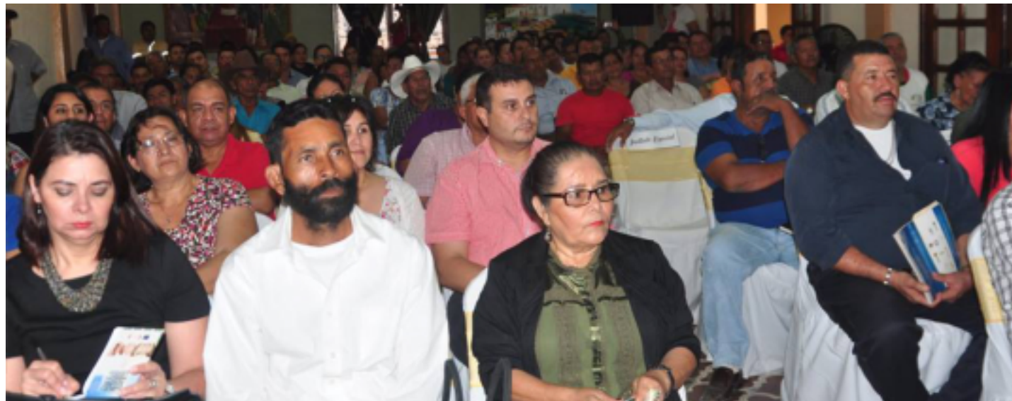
Comisión de Transparencia, patronatos, instituciones, sociedad civil, entre otros, presenciaron la rendición de cuentas de 2016.

En este evento se contó con la presencia de más de 200 ciudadanos representantes de instituciones públicas, privadas y patronatos comunales, quienes se marcharon totalmente satisfechos por que observaron la buena administración de los fondos que realiza esta alcaldía.