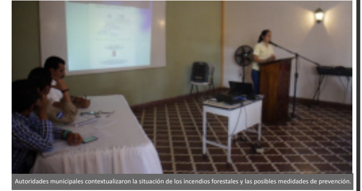
Autoridades municipales contextualizaron la situación de los incendios forestales y las posibles medidas de prevención.

“Es una campaña a nivel de municipio, que se realiza año con año a inicio de la temporada de verano, esto implica hacer una sinergia con las demás instituciones para controlar los incendios en el Parque Nacional Montaña de Comayagua y la Cordillera de Montecillos, ya que, son las áreas más importantes de protección forestal; además, el propósito de esta campaña no solo es combatir los