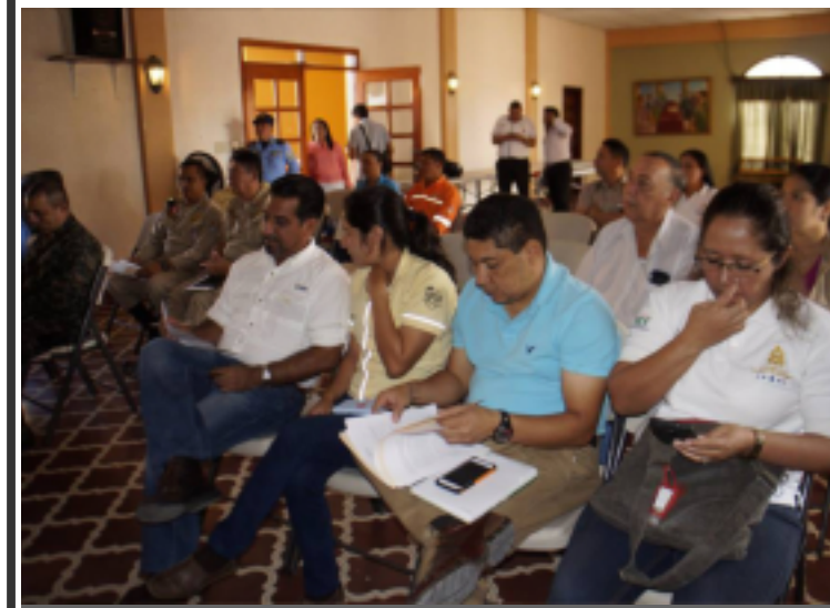
La Alcaldía de Comayagua trabajará en conjunto con diversas instituciones en temas de prevención de incendios forestales en la zona.

Cabe resaltar que el gobierno local reconoce que en la ejecución de esta campaña, el apoyo de la comunidad y el aporte interinstitucional juegan un papel importante para lograr un municipio libre de incendios forestales.