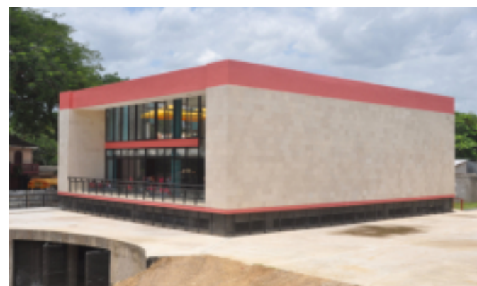
Centro Municipal de la Juventud, edificio moderno para el desarrollo del conocimiento y habilidades de los jóvenes de Comayagua.

Hasta la fecha se trabaja con 12 jóvenes, una vez que estén preparados en la elaboración de calzado se conformaran en microempresas y la alcaldía les facilitará el capital semilla, luego ingresaran otros 12 jóvenes y así sucesivamente podrán formar microempresas, para poder competir a tanto a nivel local como nacional.