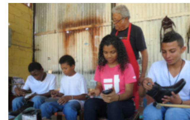
Una de las novedades de la Escuela Taller es la creación del Taller de Zapatería, este proyecto se ejecuta con fondos municipales

Comayagua, una ciudad para vivir, visitar e invertir.