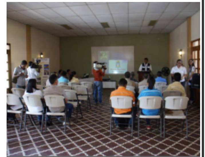
Las instituciones involucradas presentaron sus compromisos, acuerdos y sugerencias para trabajar de forma coordinada.

Comayagua, una ciudad para vivir, visitar e invertir.