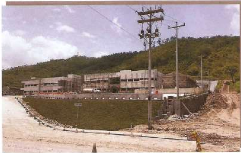
FACHADA FRONTAL EDIFICIO ADMINISTRATIVO Y DORMITORIOS