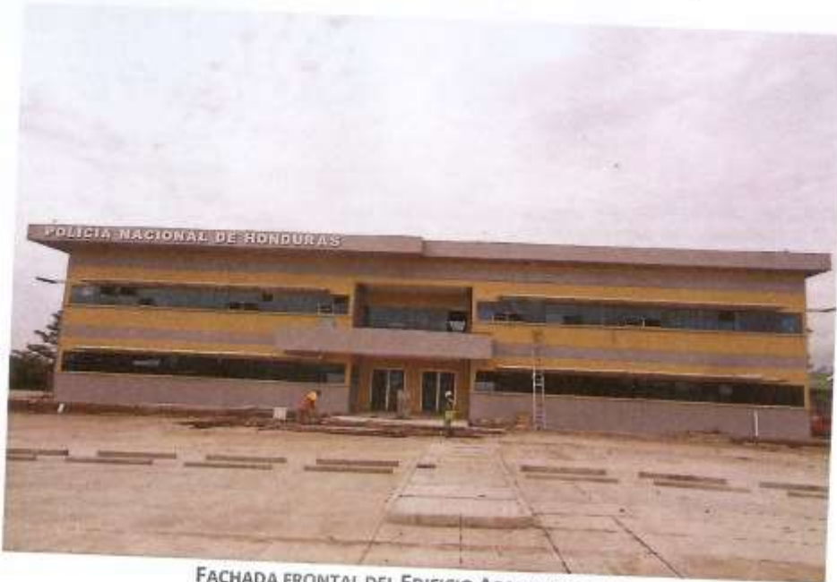
FACHADA FRONTAL DEL EDIFICIO ADMINISTRATIVO