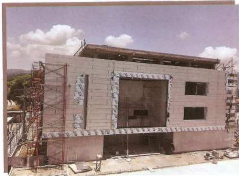
FACHADA FRONTAL LABORATORIO