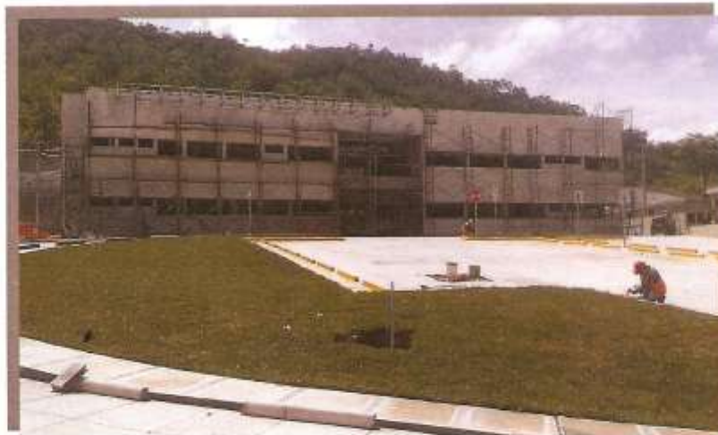
FACHADA FRONTAL EDIFICIO ADMINISTRATIVO

Préstamo No.2745/BL-HO Programa de Apoyo a la Implementación de la Política Integral de Convivencia y Seguridad Ciudadana. Aldea El Ocotal, Comayagüela, M.D.C., Honduras, C.A. Tel: (504) 2229-0083