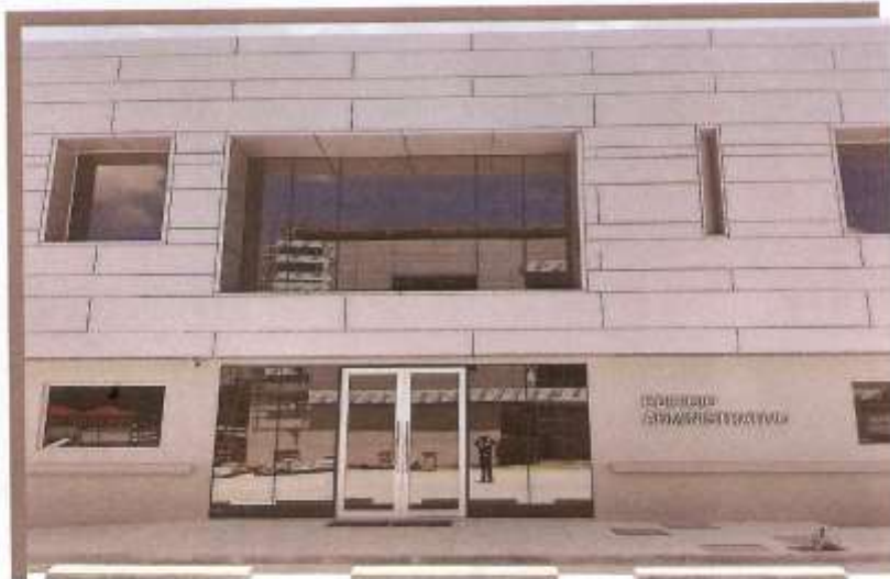
FACHADA FRONTAL EDIFICIO ADMINISTRATIVO

Préstamo No.2745/BL-HO Programa de Apoyo a la Implementación de la Política Integral de Convivencia y Seguridad Ciudadana. Aldea El Ocotol, Comayagüela, M.D.C., Honduras, C.A. Tel: (504) 2229-0083