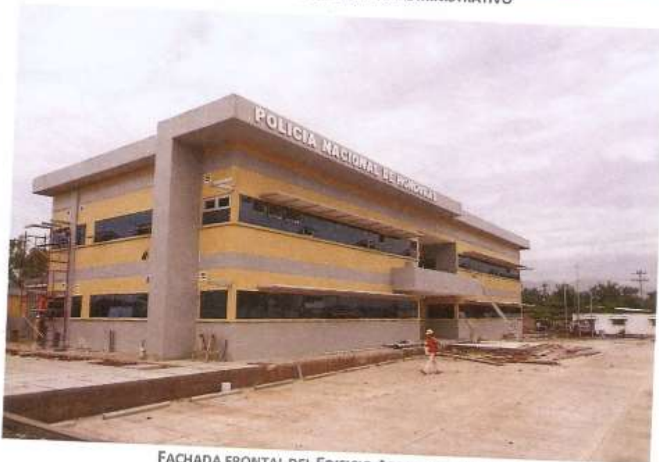
FACHADA FRONTAL DEL EDIFICIO ADMINISTRATIVO

Préstamo No.2745/BL-HO Programa de Apoyo a la Implementación de la Política Integral de Convivencia y Seguridad Ciudadana. Aldea El Ocotal, Comayagüela, M.D.C., Honduras, C.A. Tel: (504) 2229-0083