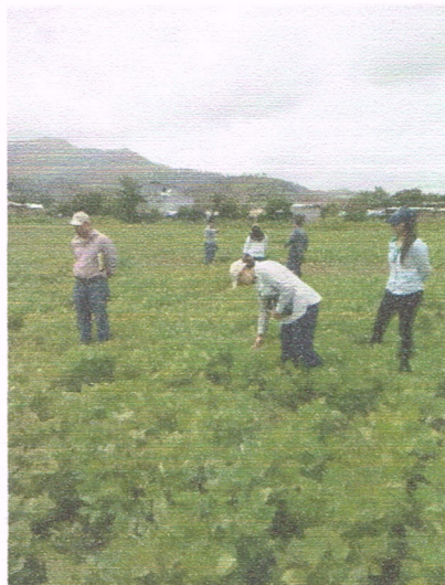
Vista representantes Zamorano