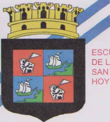
ESCUDO DE ARMAS DE LA CIUDAD DE SAN JUAN PUERTO CABALLOS HOY PUERTO CORTES