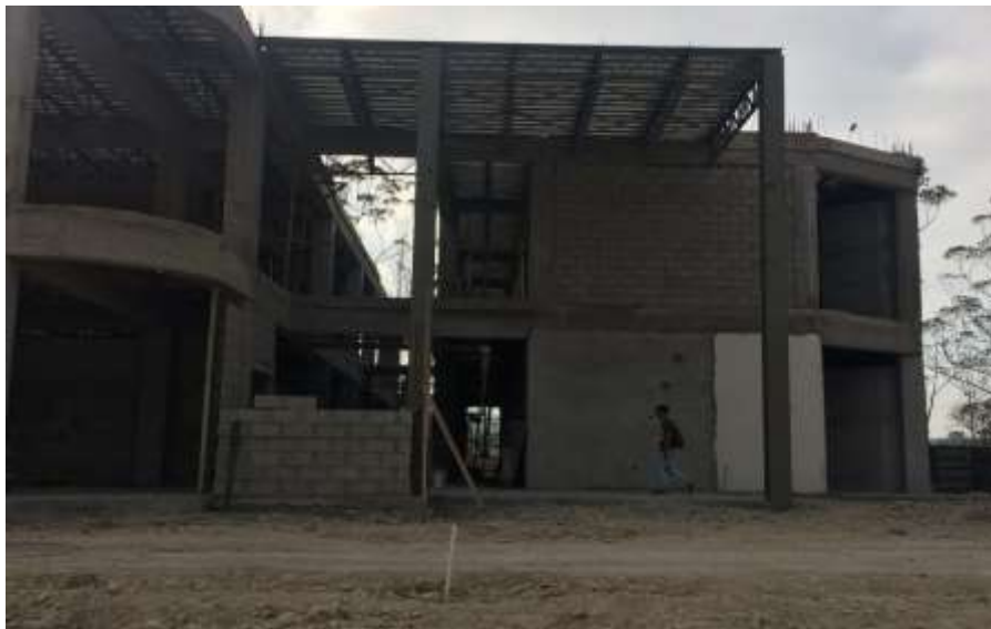
Armado de Joist con cuerda superior e inferior de ángulo doble de 2"x3/16 y diagonales reforzadas de ángulo doble intercalado de 1"1/8" a 45°@ 1 metro