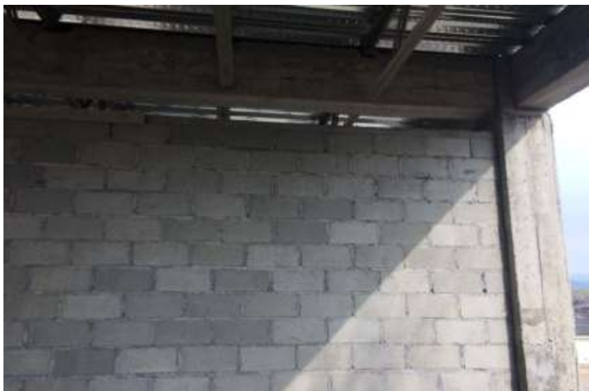
Colocación de bloque de 4" con bastoneado, fundido con concreto 2500PSI