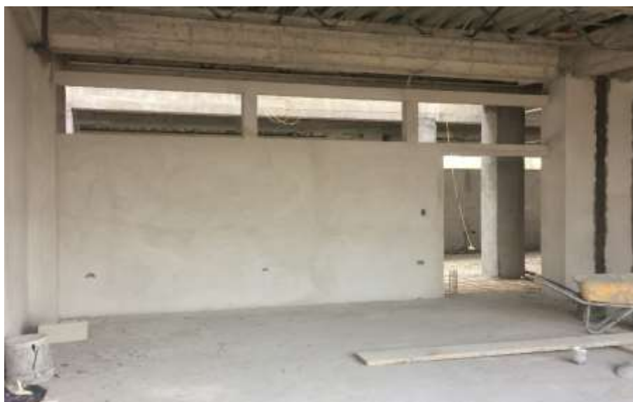
Tallado de Elementos Estructurales