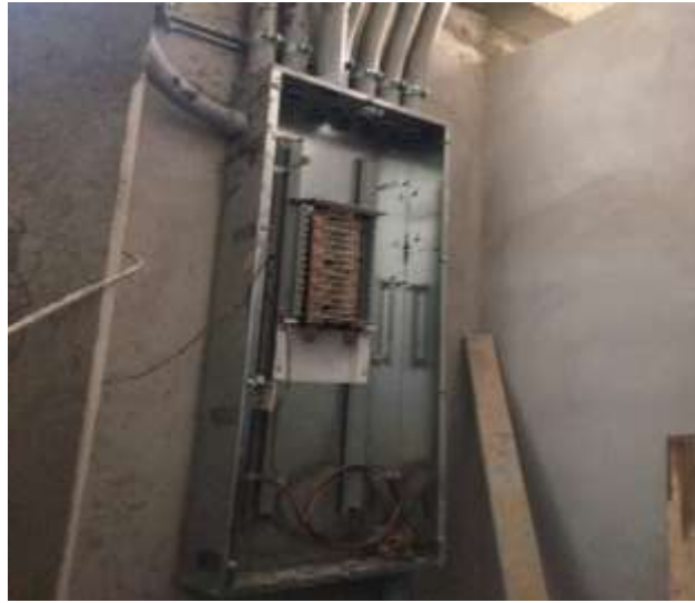
Panel de Distribución con Main Breaker