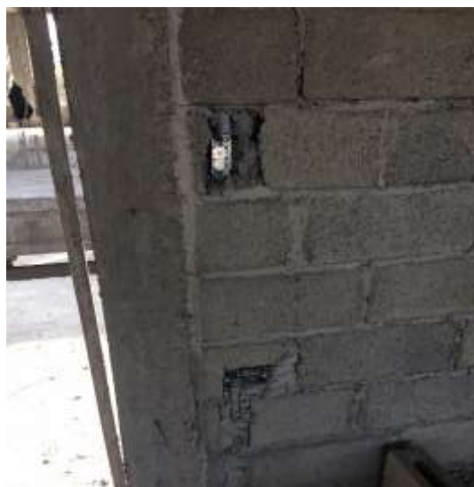
Salidas eléctricas para interruptores