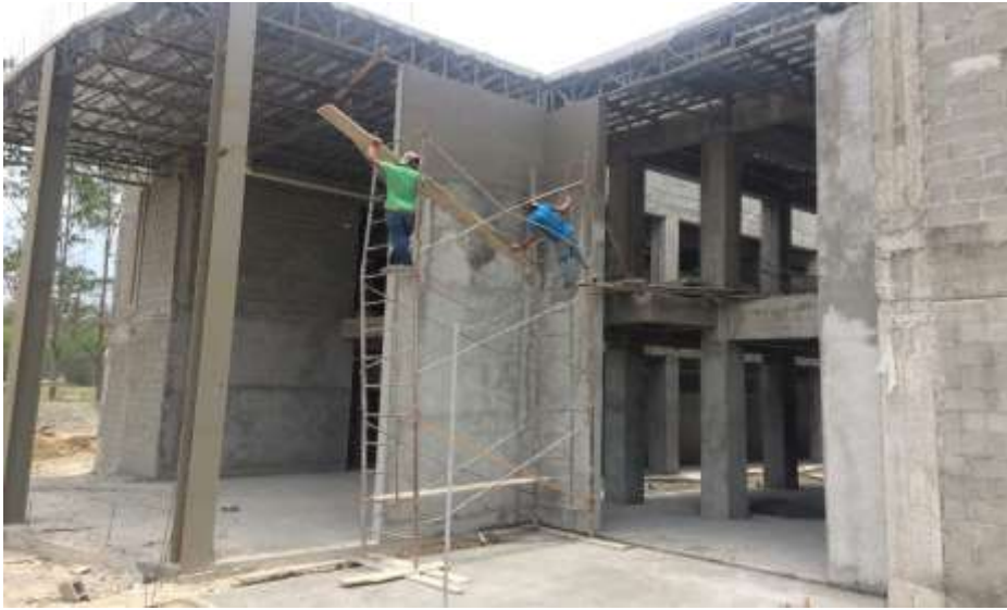
Repello en Paredes