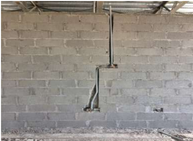
Tomacorrientes en Aulas