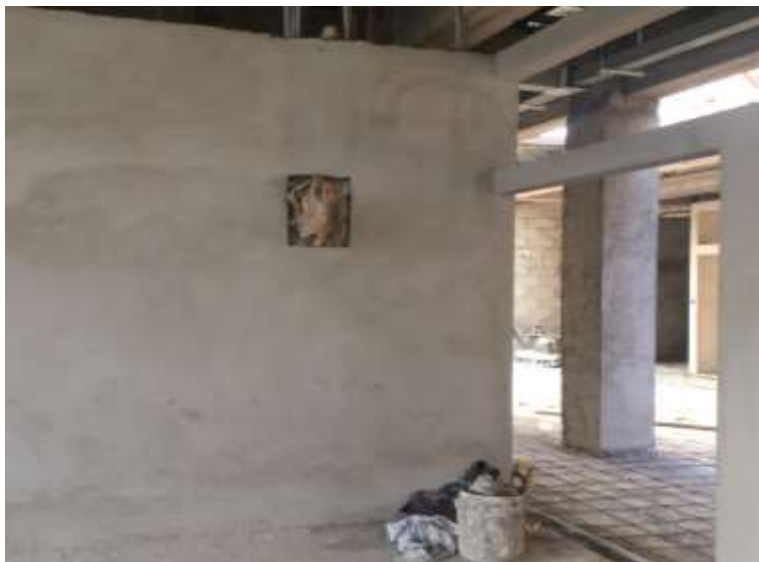
Panel de 6 espacios