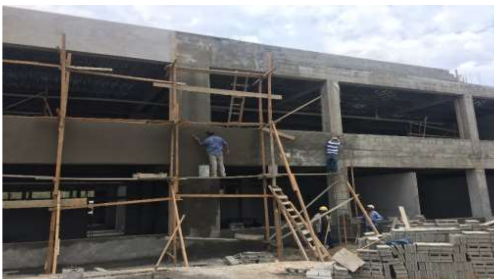
Tallado de Elementos Estructurales