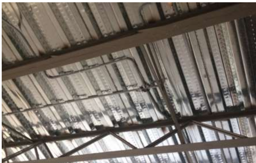
Salidas eléctricas para lamparas de 2x4