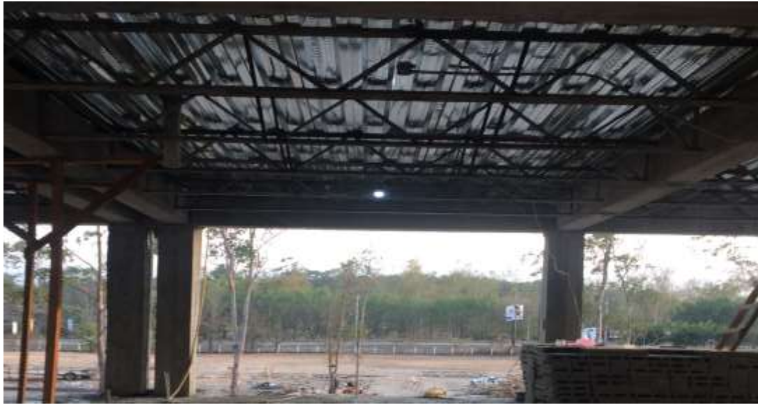
Colocado de Joist