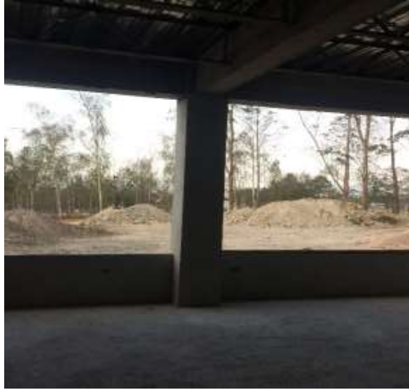
Tomacorrientes en Aulas