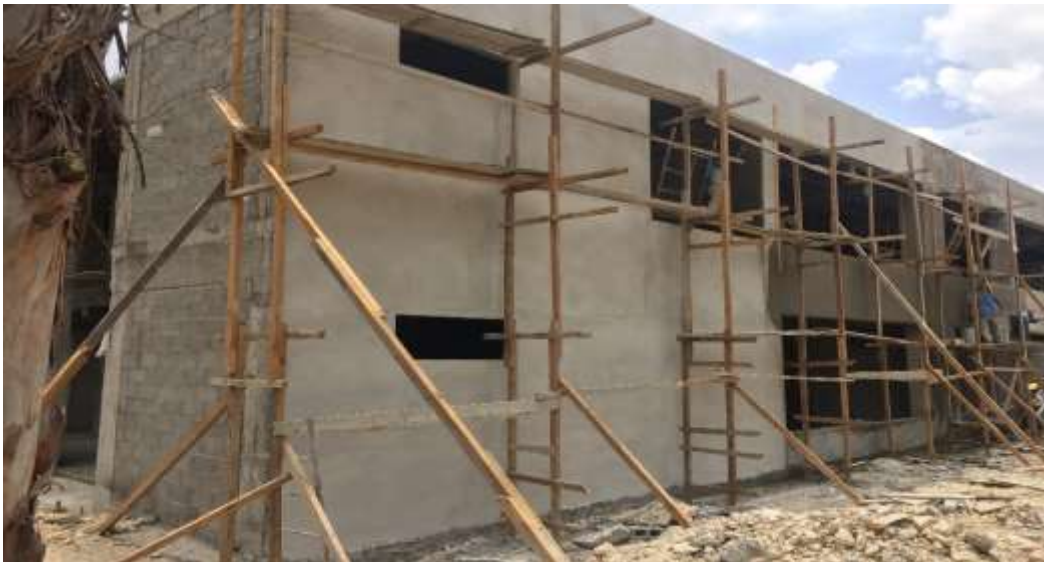
Pulido en Paredes