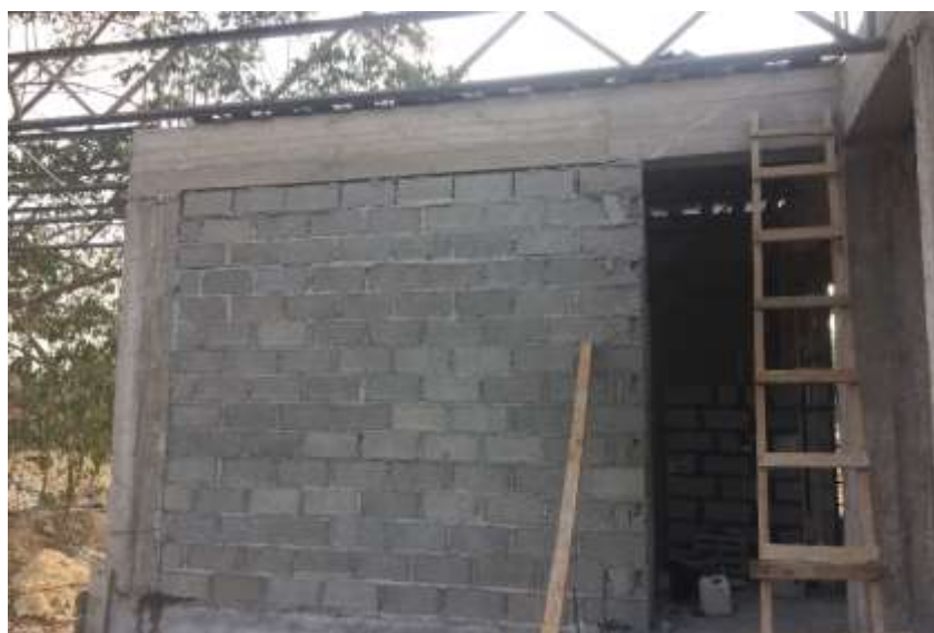
Colocación de bloque de 4" con bastoneado, fundido con concreto 2500PSI