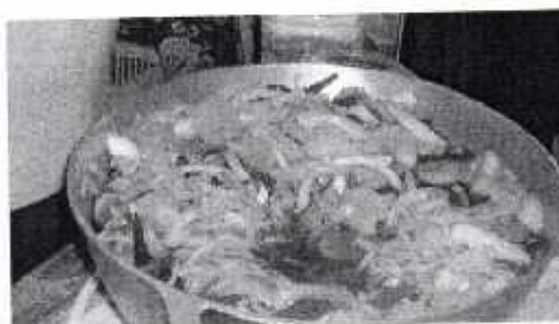
Fotografía X "Producto Final "