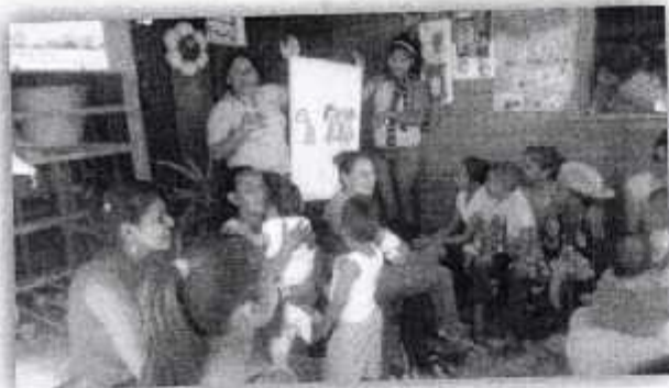
Fotografía II "Charla Relaciones Interpersonales"