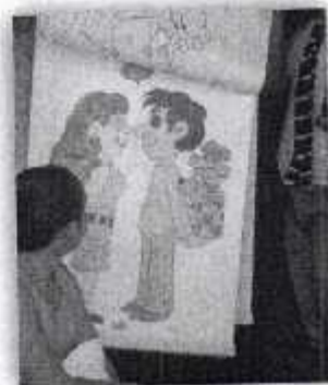
Fotografía III " Material Didáctico"