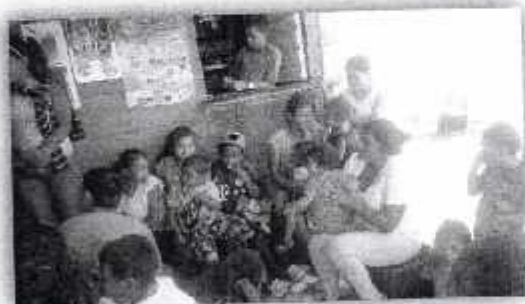
Fotografía IV " Pobladores Asistentes"