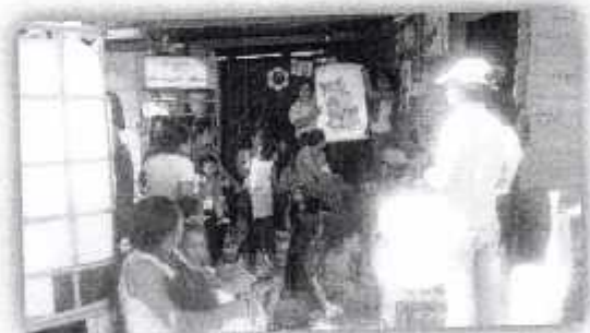
Fotografía V " ETC impartiendo Charla"