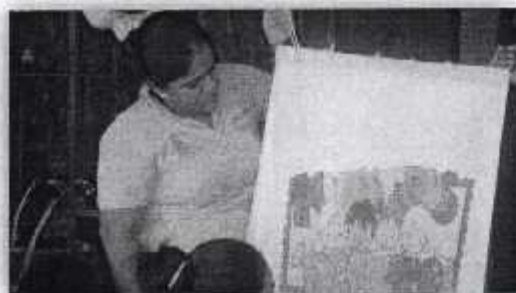
Fotografía VI "Material Didáctico "