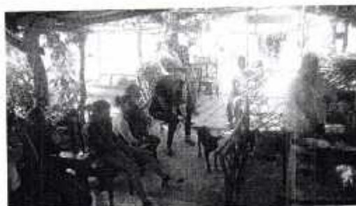
Fotografía IX "Elaboración del Encurtido "