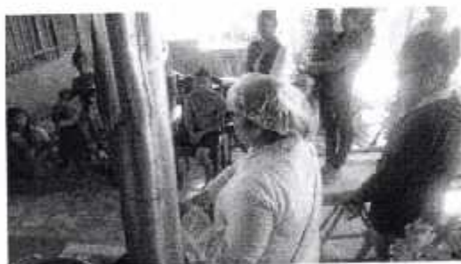
Fotografía VIII "Explicación del Proceso de elaboración "