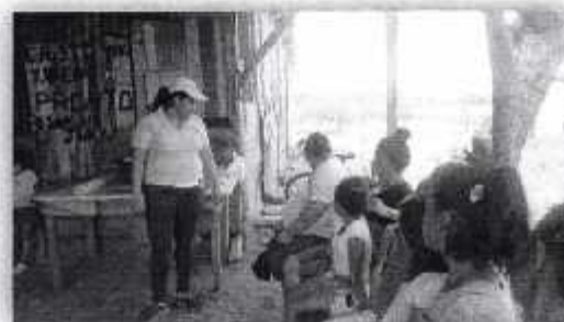
Fotografía VII " Pobladores Asistentes"