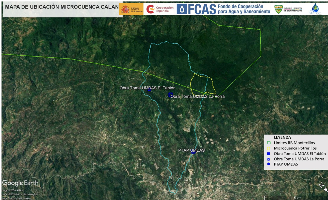
Imagen 3 Ubicación geográfica microcuenca Calan.