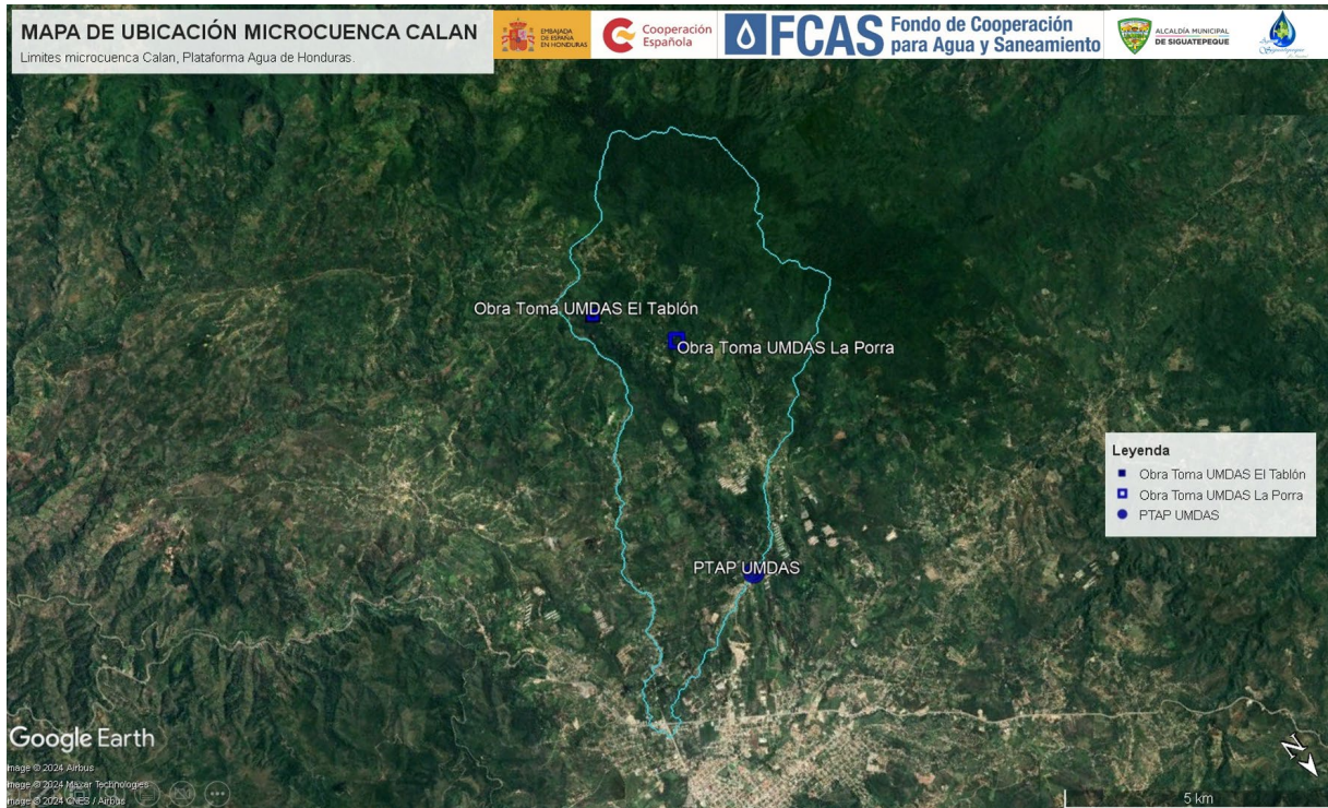
Imagen 1 Ubicación de la microcuenca a intervenir.