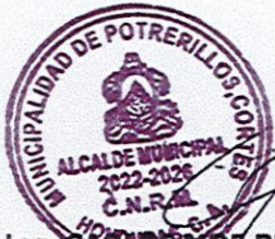
Ing. CARLOS NOE RIVERA MANZANARES ALCALDE MUNICIPAL

obra en el plazo convenido. Si la demora se produjere por causas no imputables al Contratista, incluyendo, pero no limitándose a la falta de pago en la forma y plazos especificados en el Contrato, la Administración autorizará la prórroga del plazo por un tiempo igual al atraso y la falta de entrega de la información a tiempo. Y ARTÍCULO 121.- MODIFICACIÓN DE LOS CONTRATOS. La Administración podrá modificar por razón de interés público, los contratos celebrados y acordar su resolución, dentro de los límites y con sujeción a los requisitos y efectos señalados en la presente Ley y sus normas reglamentarias, y ARTÍCULO 123.- Fundamento y efectos. Toda modificación deberá ser debidamente fundamentada y procederá cuando concurren circunstancias imprevistas al momento de la contratación o necesidades nuevas, de manera que esa sea la única forma de satisfacer el interés público perseguido. CLAUSULA TERCERA: Debido a que el proyecto no tiene dentro de sus actividades a realizar el pintado de los Bordillos, y que se realizó una ampliación monetaria con un costo de Lps. 9,850.00 siendo un monto total del proyecto de Lps. 2,000,000.00. CLAUSULA CUARTA: RATIFICACION: Ambas partes manifiestan estar de acuerdo con el contenido de todas y cada una de las cláusulas que anteceden, las ratifican y se obligan al cumplimiento de las mismas, En fe de lo cual, firmamos en la ciudad de Potrerillos, Municipio de Cortes, a los Veinte y Nueve Días del Mes de Febrero del Año Dos Mil Veinte y Cuatro.