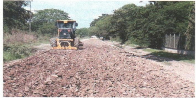
Mejoramiento Carretera RN39-Corral Viejo