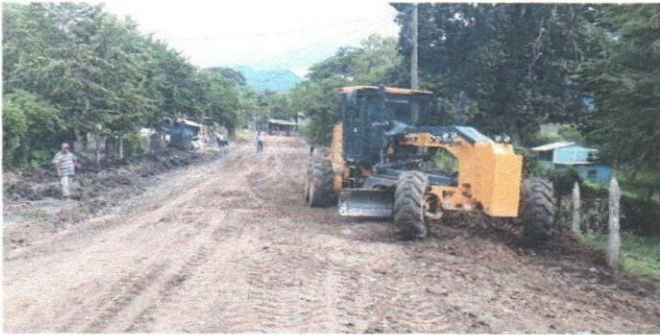
Reparación Carretera Las Delicias