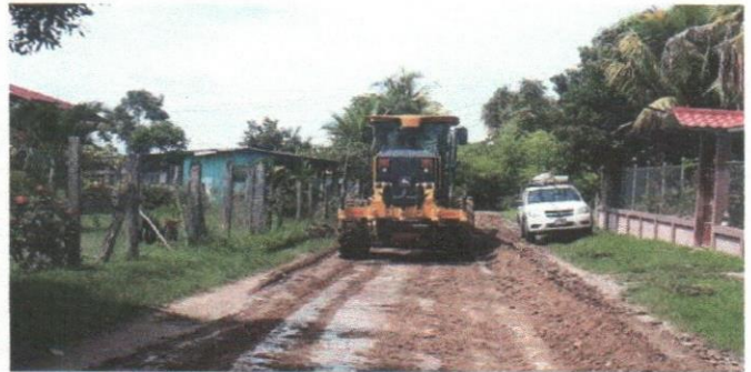
Mejoramiento de Carretera Berverias - Moreno