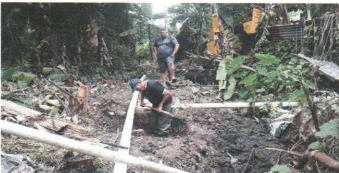
Aguas Negras Peru