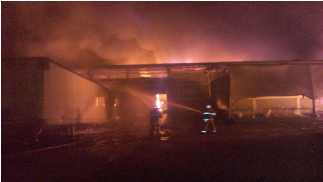
Incendio de Grandes Proporciones en la Empresa Cirsa Honduras