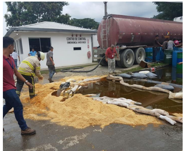
Derrame de Aceite Vegetal