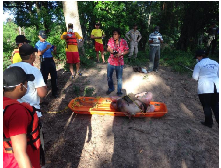
Recuperación de Cadáver en el Rio Ulúa