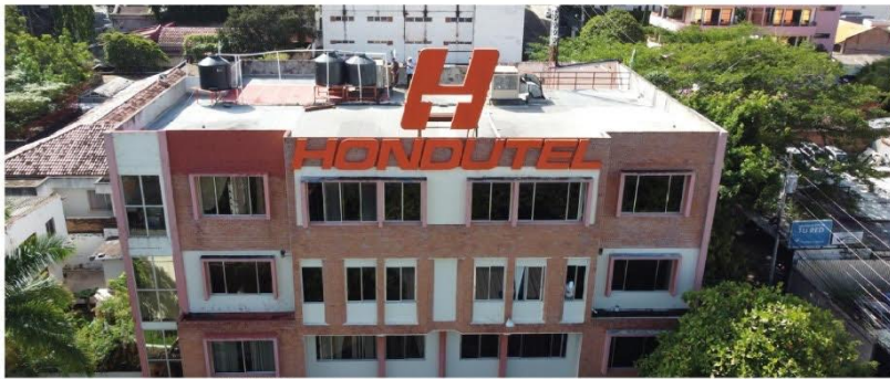
HONDUTEL CONTINÚA AVANZANDO EN SU PROCESO DE TRANSFORMACIÓN Y RECUPERACIÓN.

como un proveedor de servicios de internet corporativo. De acuerdo al Ing. Morales, este avance ha llevado a una desaceleración profunda en las pérdidas de la empresa, lo que ha permitido estabilizar la situación financiera y posicionar a HONDUTEL como un proveedor de servicios de internet corporativo. El plan de rescate de la empresa está en marcha; la segunda fase de esta estrategia se enmarca en el sector residencial, que contempla el lanzamiento de una oferta de televisión y fibra óptica residencial.