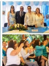
TRABAJADORES Y AUTORIDADES CELEBRARON EL DÍA DE LA BANDERA EN CONMEMORACIÓN DE LOS 203 AÑOS DE INDEPENDENCIA PATRIA.

Con fervor, entusiasmo, y un profundo sentido de patriotismo, los trabajadores de la Empresa Hondureña de Telecomunicaciones (HONDUTEL), dieron inicio al mes patrio celebrando el Día de la Bandera Nacional.