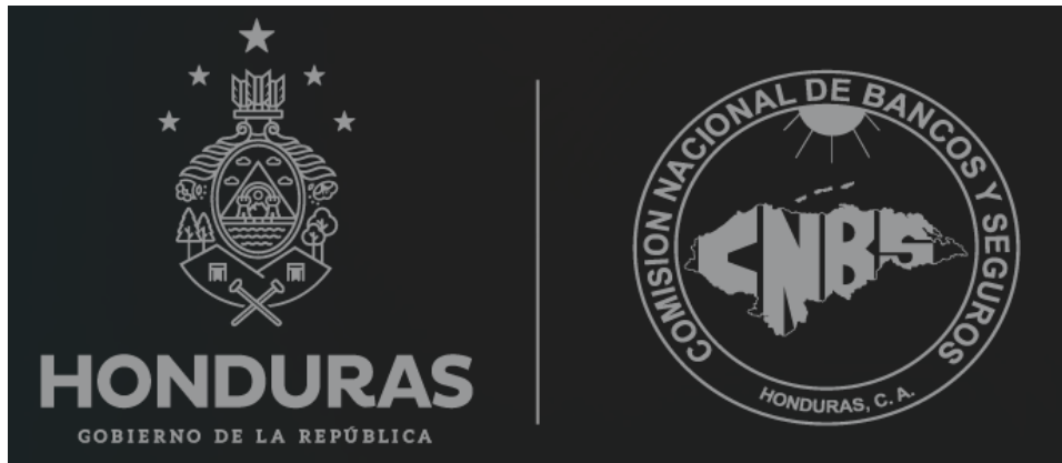
a. Escudo y Logo Gris