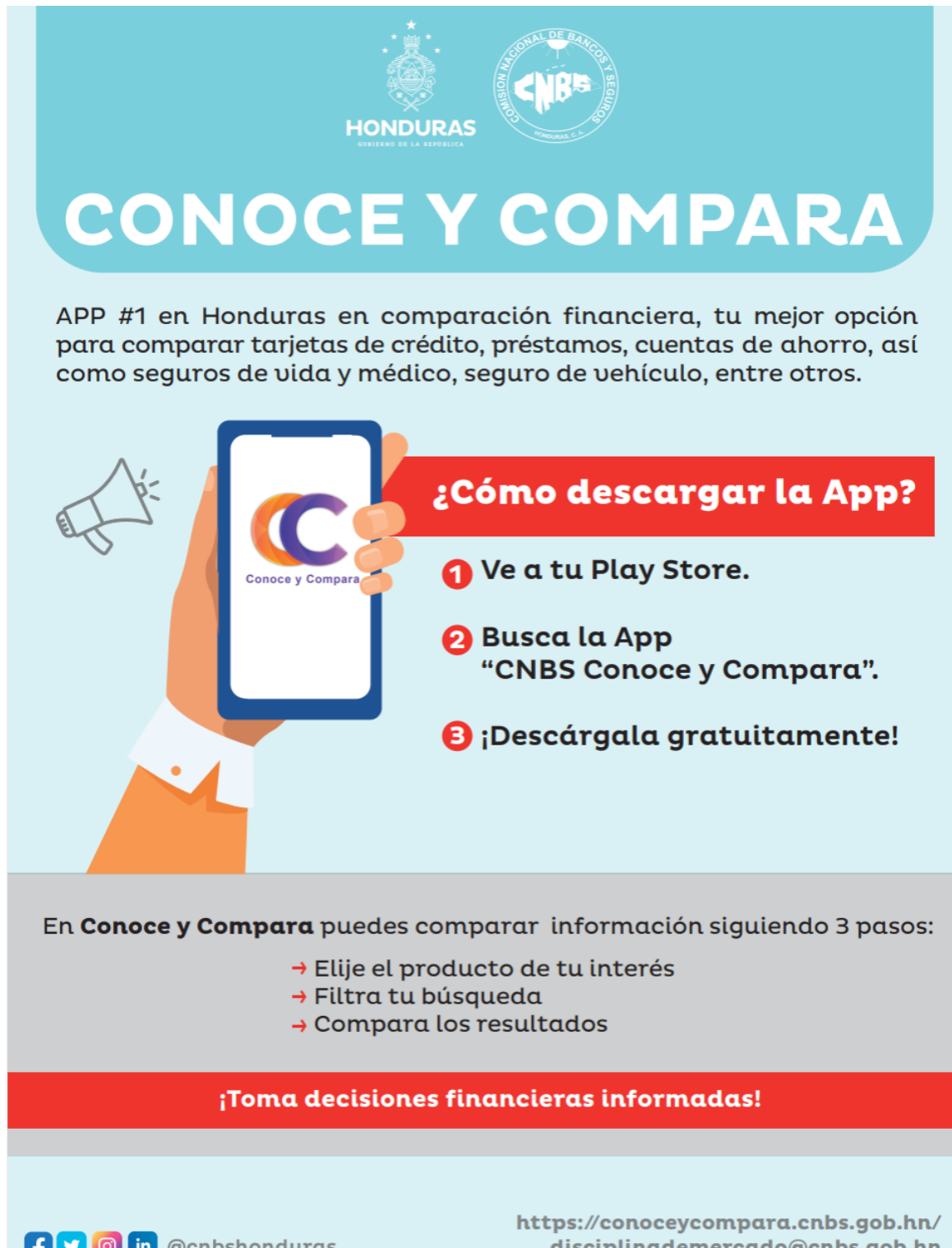
c) Dos (2) Banners “CONOCE Y COMPARA”