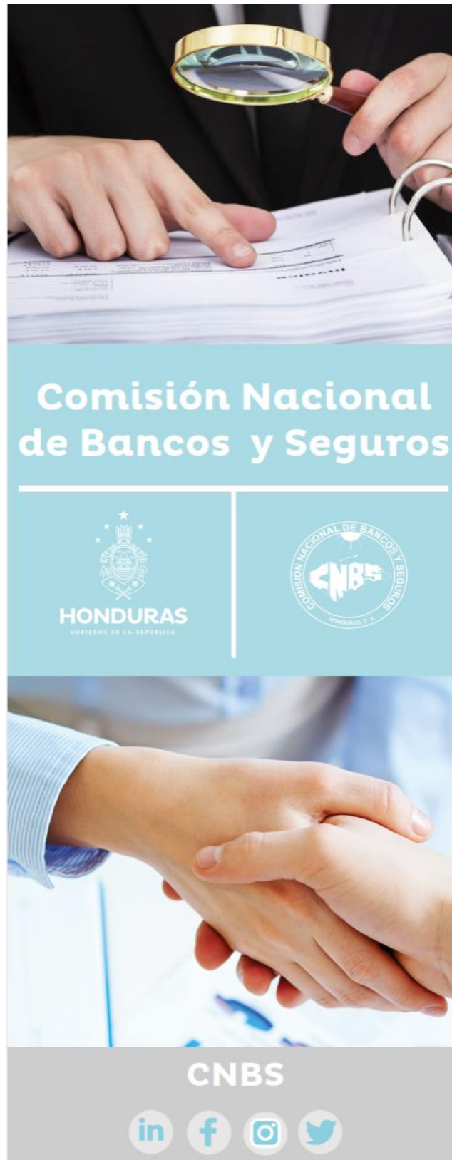
b) Cinco (5) Banners “CNBS”