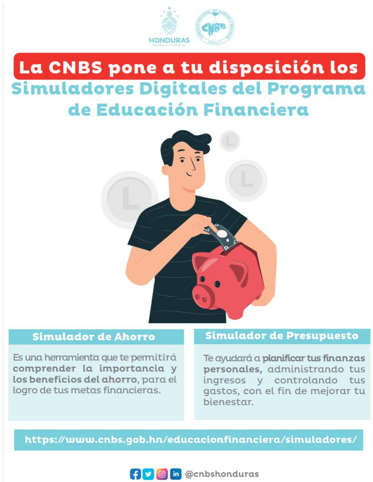
d) Cuatro (4) Banners “SIMULADORES”