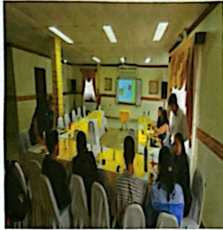
• Tema: "Taller de capacitación sobre Derecho Minero y Licencias ambientales" Santa Rosa de Copan, Copan Fecha :14-08-2024