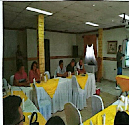
• Tema: "Taller de capacitación sobre Derecho Minero y Licencias ambientales" Santa Rosa de Copan, Copan Fecha :15-08-2024