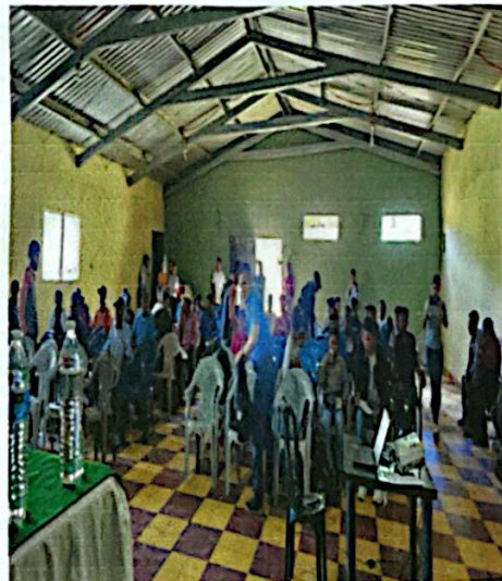
Tema: "Gestión Ambiental en la Actividad Minera en el país" UNICAH Tegucigalpa, Francisco Morazán. Fecha 26-07-2024.