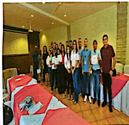
Tema: “Taller de capacitación sobre Derecho Minero y Licencias ambientales” Copan Ruinas, Copan Fecha :13-08-2024