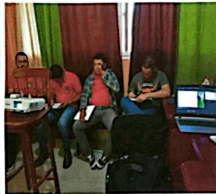
Tema: “Control y seguimiento de Derechos Mineros” San Francisco de Ojuera, Santa Bárbara. Fecha 08-08-2024.