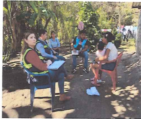
Gira a las comunidades de Zapotillo y Taragual por caso de vulneración con CONADEH Y SENAF