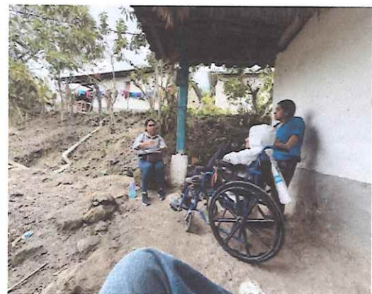
Gira a la comunidad de Lagunas.